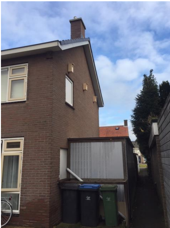
Foto 2. Foto geplaatste kasten in de Plevierstraat in Zaltbommel