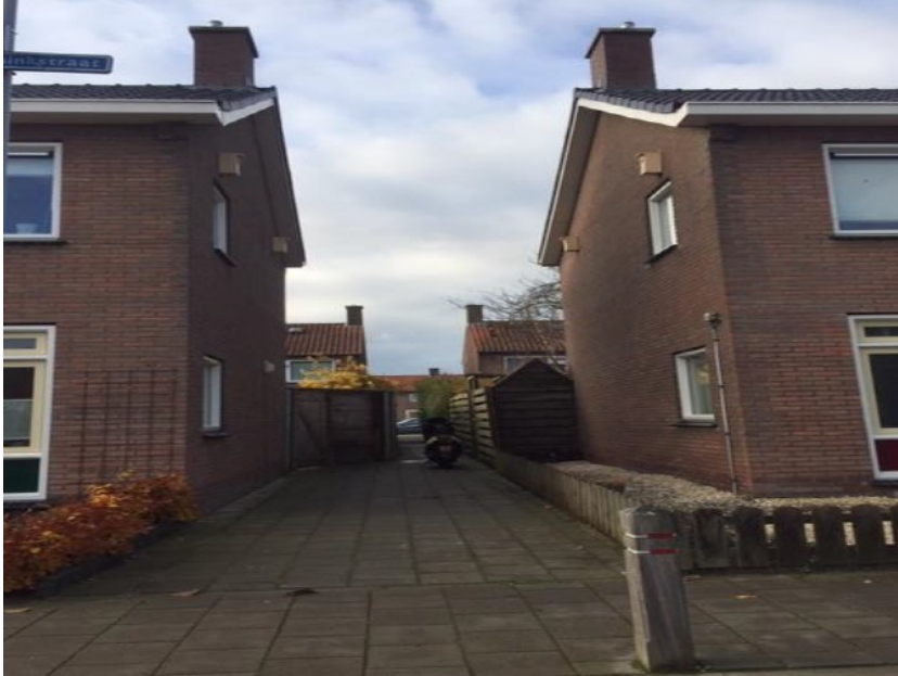
Foto 1. Foto geplaatste kasten in de Burgemeester Buissinkstraat in Zaltbommel