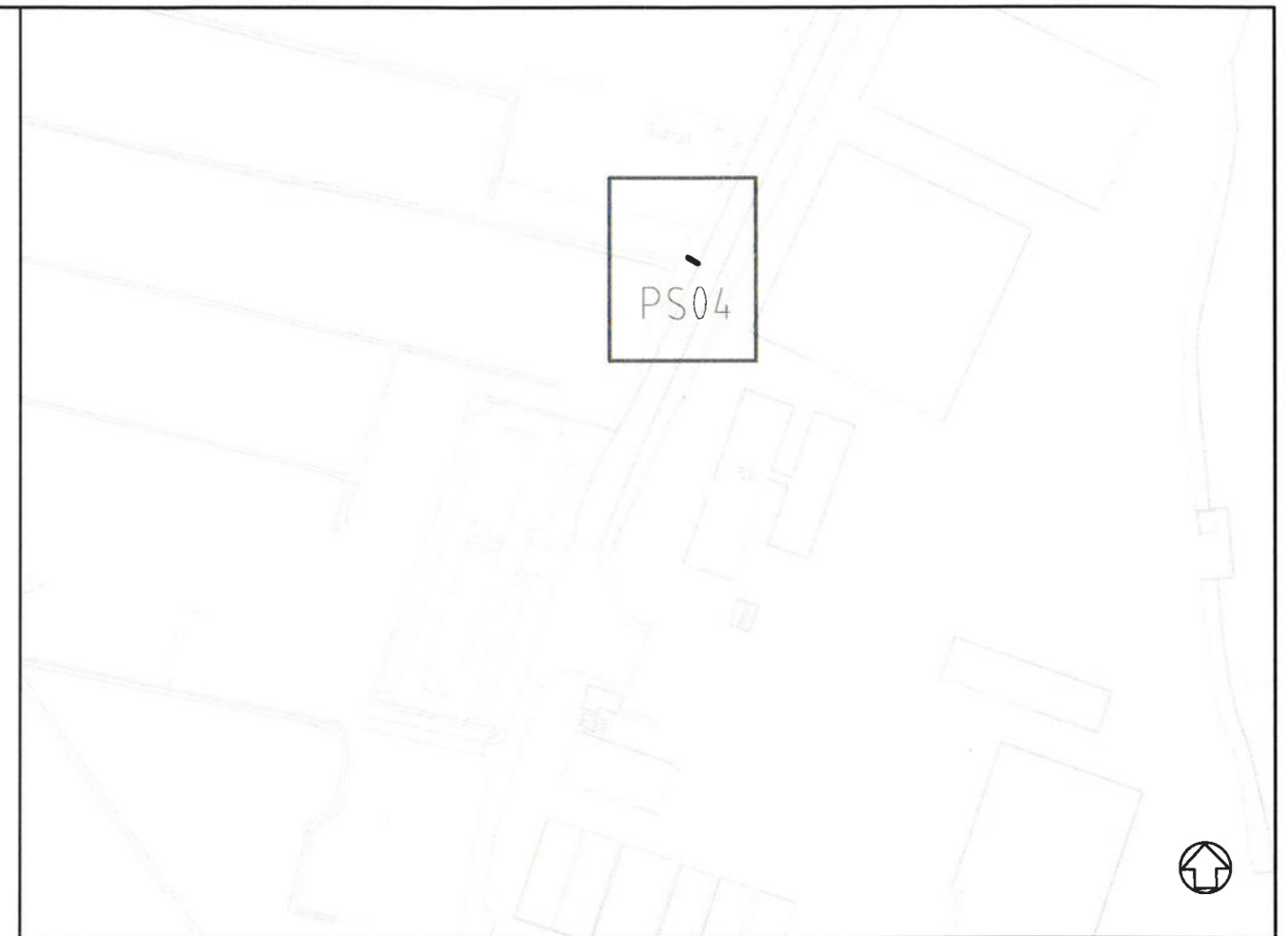
Overzicht Schaal 1:2000