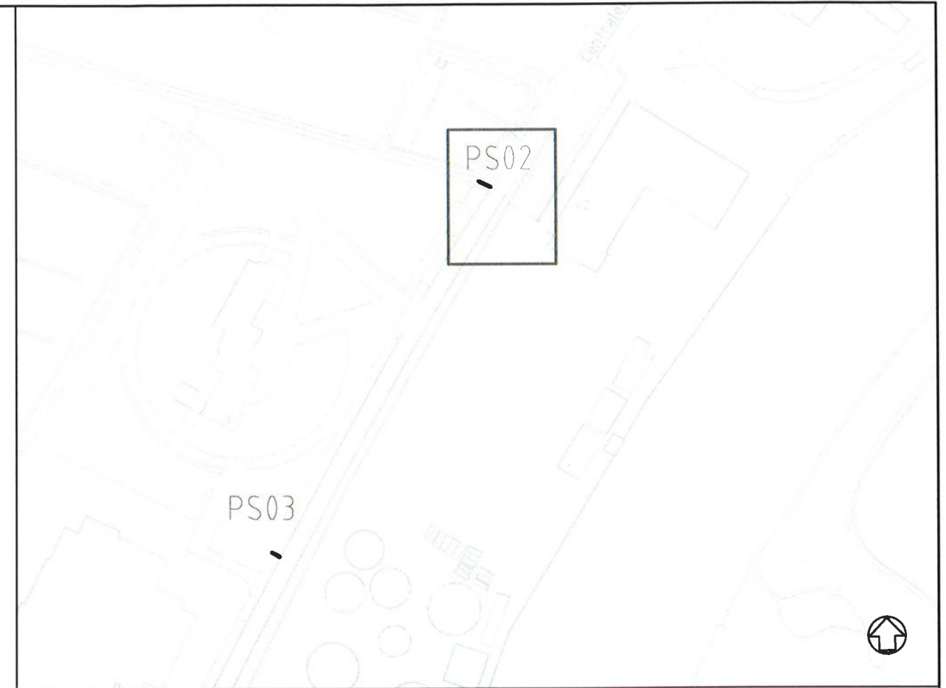
Overzicht Schaal 1:2000