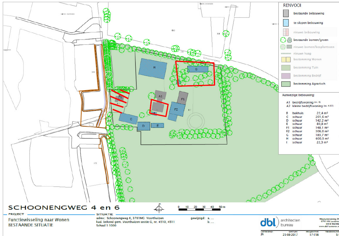
Figuur 2: Te slopen bebouwing; de rood omlijnde en gearceerde bebouwing blijft behouden