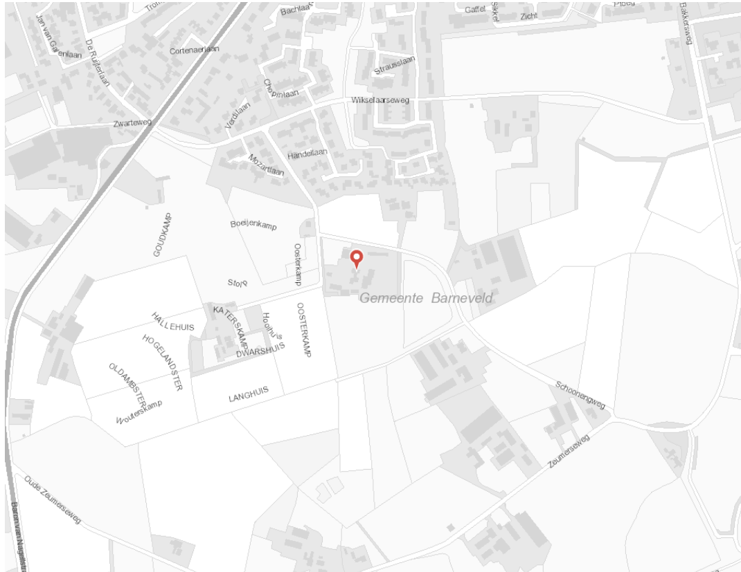
Figuur 1: Locatie Schoonengweg 6 te Voorthuizen