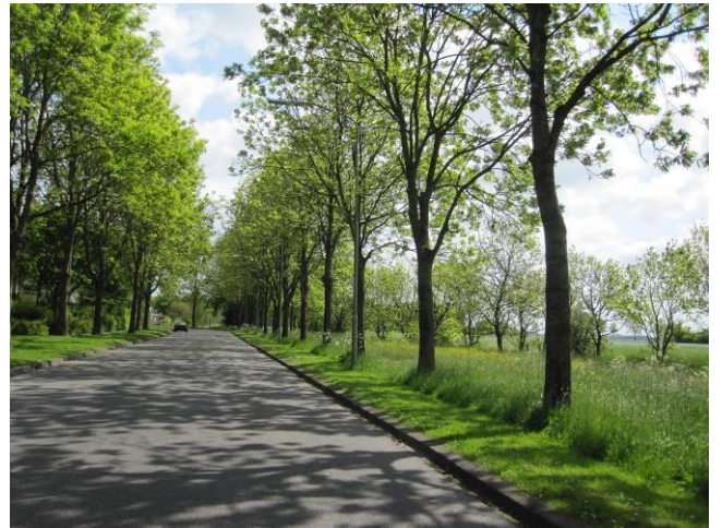
sterk - laanstructuren als overgang naar het landschap in wijk Ripperda