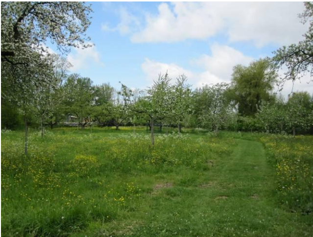
sterk - boomgaard, groene ruimte in de wijk