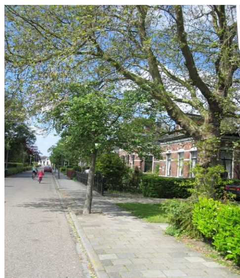
zwak - laan naar het station