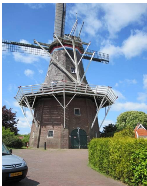
sterk - openheid rond de molen