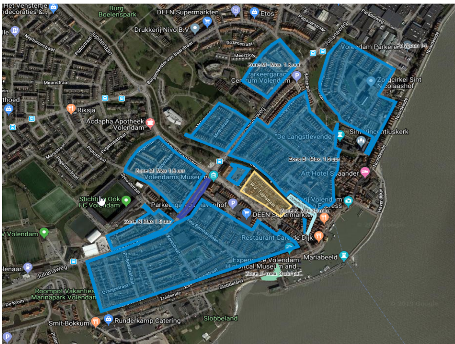
Afbeelding 2: Parkeerschijfzones en vergunning parkeren oude kom Volendam

In de oude kom van Volendam zijn 4 verschillende parkeerregimes van kracht. In het overgrote deel is een parkeerschijfzone van kracht. In de Spoorbuurt, op parkeerterrein Parallelweg en achter het Zuideinde oneven kant deels vergunning parkeren, in de Parkeergarage Havenhof, parkeergarage Boegstraat en parkeerterrein achter Hotel Spaander betaald parkeren en op het Slobbeland, Maria Goretti terrein, Bokkingstraat en een deel van de Foksiastraat bij de openbare bibliotheek en het Boelenspark nabij de seniorenappartementen vrij parkeren. Op afbeelding 2 zijn de parkeerschijfzones en het vergunning parkeren Spoorbuurt aangegeven.