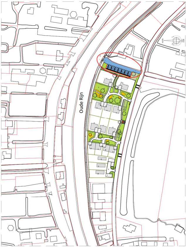
Overzicht situatie 1:1000