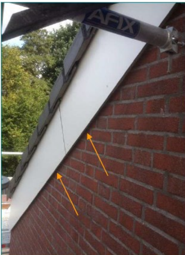
Figuur 5. Kopgevel met aangebrachte boeiboord. De pijlen geven enkele invliegopeningen voor vlermuizen weer in verschillende compartimenten.