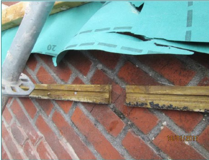
Figuur 4. Muurlatten voor bevestiging boeiboord met opening voor toegang vlermuizen achter boeiboord. Folie wordt weggesneden.