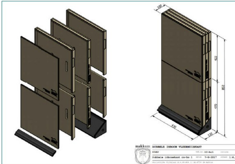
Figuur 2. Schematische weergave van toegepaste Tichelaarkasten.