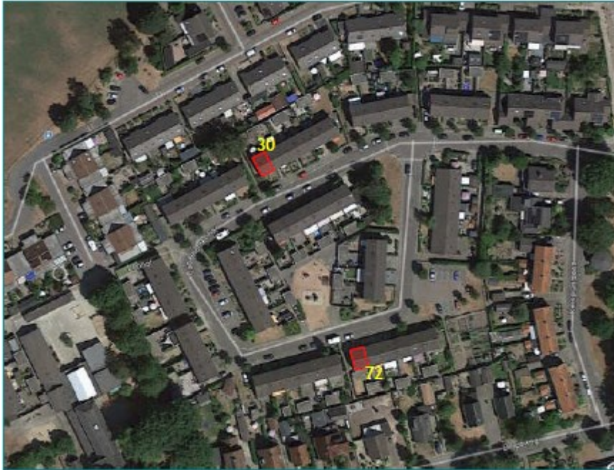
Figuur 1. Ligging twee woningen aan de Van Rhemenhof in Spankeren