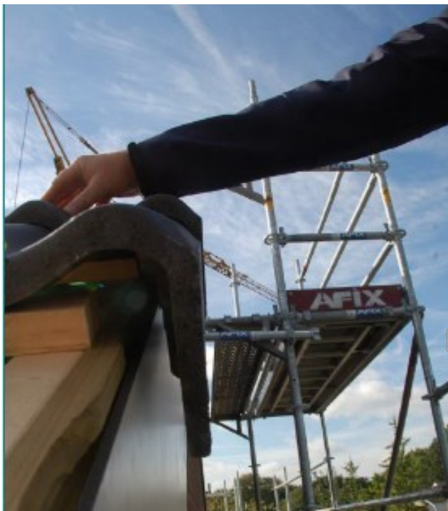
Figuur 3. Afstand van 3 cm tussen boeiboord en gevelpan. Hierdoor ontstaat een invliegopening en toegang tot de ruimte onder de dakpannen voor vleermuizen.