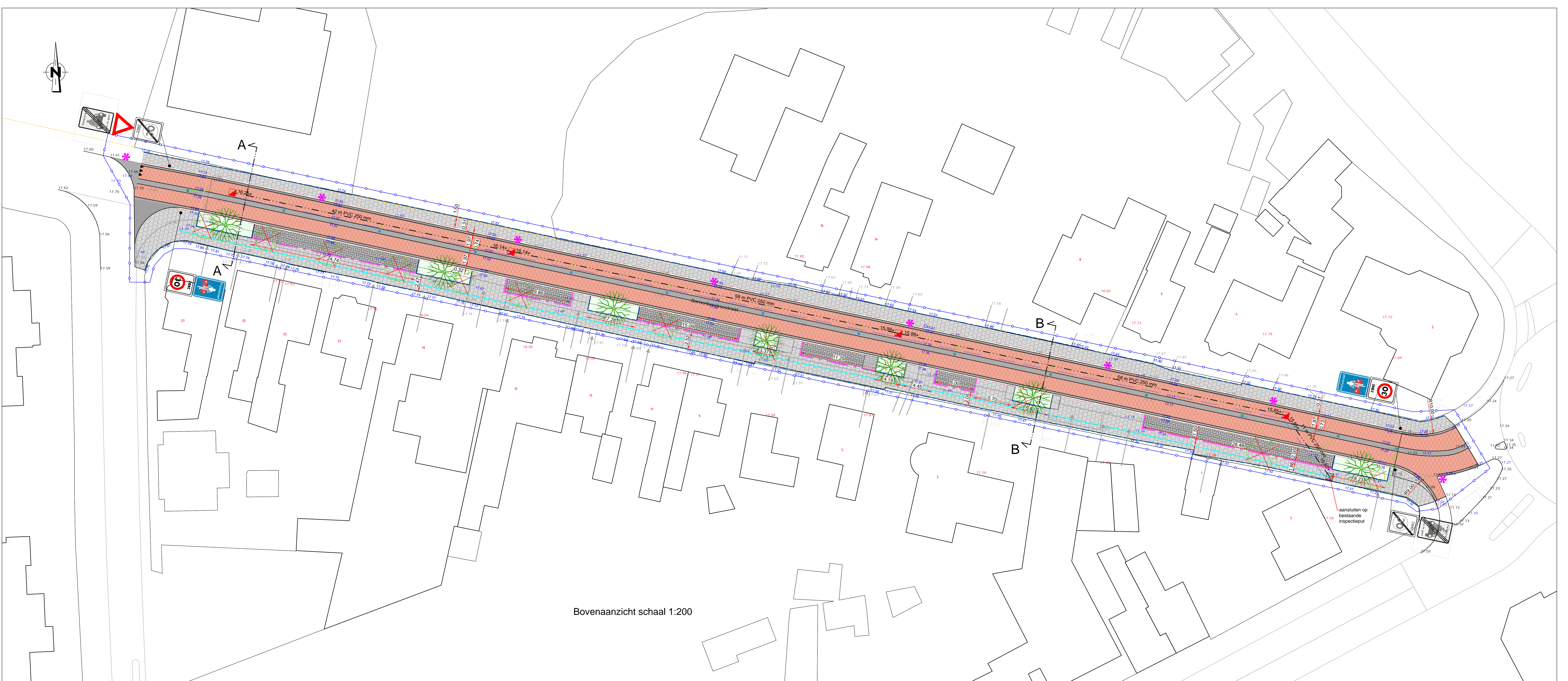
Bovenaanzicht schaal 1:200