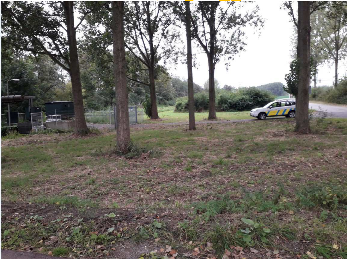
Figuur 1: Locatiefoto aanleg bypass

Door deze open verbinding wordt ongeveer 100 ha minder via het gemaal afgevoerd, waardoor het gemaal gaat voldoen aan de bemalingsrichtlijn.