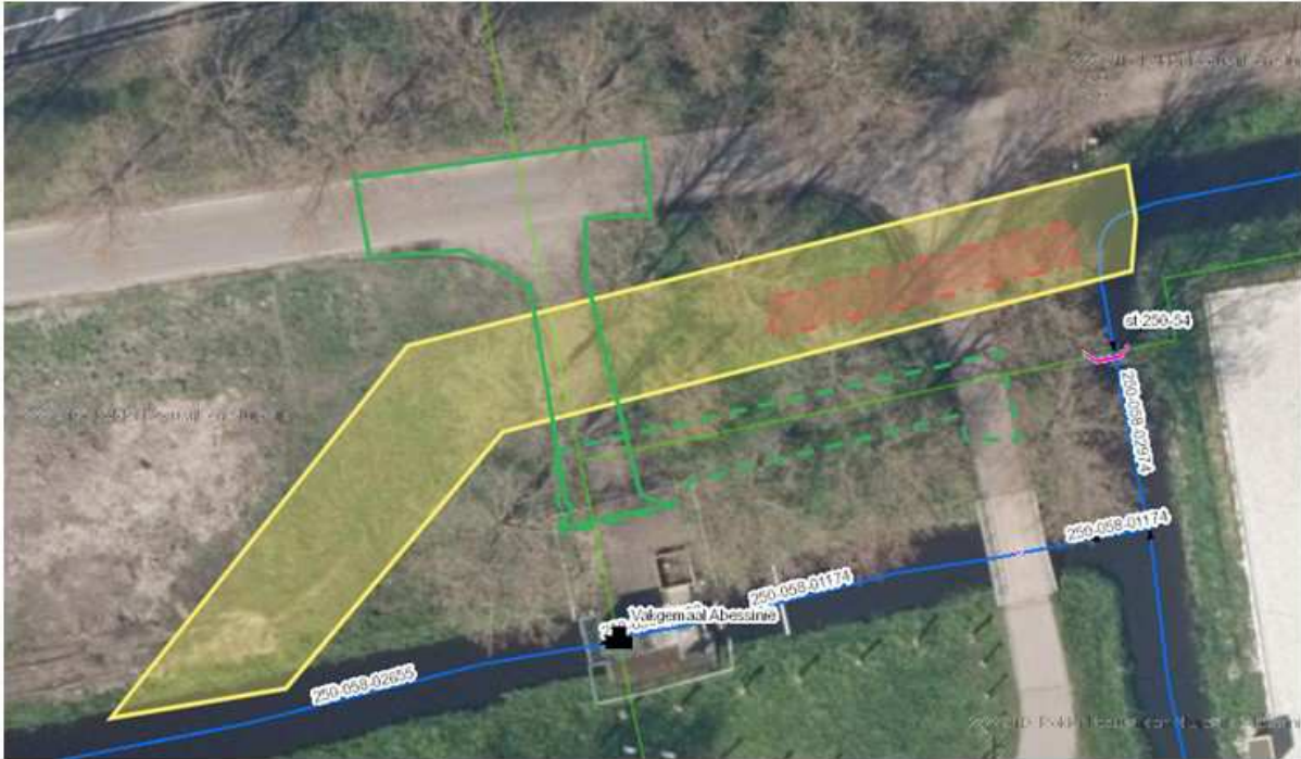
Figuur 3: Schets mogelijke aanpassing toegangspad bypass

Er is een toegangspad naar het gemaal en – naar het er nu naar uitziet – wordt dat enigszins verlegd. Zie figuur 3. De bypass bevindt zich op het moment in de ontwerpfase en de tekening is alleen ter indicatie. Het bestaande toegangspad is met groen aangegeven. De gele lijn geeft de beoogde nieuwe te graven watergang weer. De groene onderbroken lijn is het voor nu beoogde nieuwe toegangspad. Het bestaande toegangspad wordt in deze schets (deels) verwijderd. Oud en nieuw toegangspad liggen op grond van RWS.