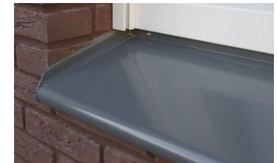
Aluminium waterslag anti-dreun met kraalrand, geanodiseerd in kleur