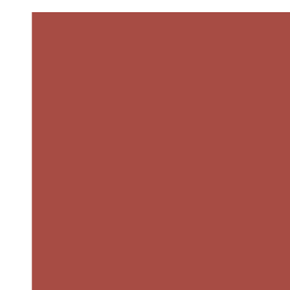
NCS 5833Y88R engels bruin, mat