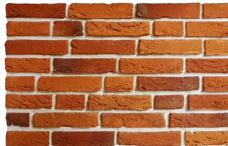
Baksteen oranje rood genuanceerd Waalformaat, wildverband. Doorstrijkmortel, 5mm verdiept, Remix 050 extra wit of gelijkwaardig