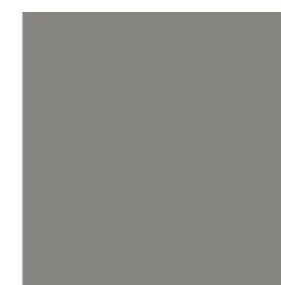
RAL 9007 grijs aluminium