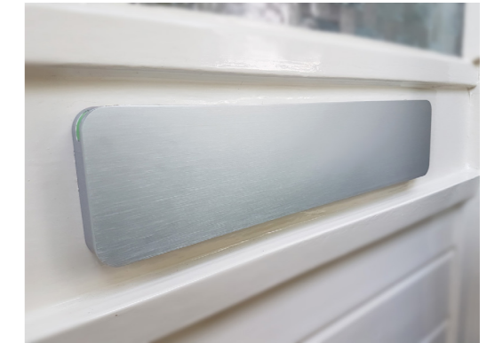
Briefklep, aluminium, geïsoleerd in kleur voordeur