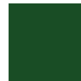
RAL 6035 parelmoerdonker- groen, mat