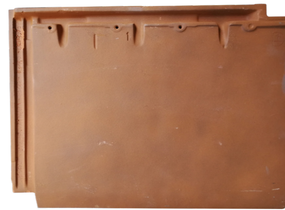
Edilians vlakke keramische pan SCU vBK55-14204 in vier verschillende tinten