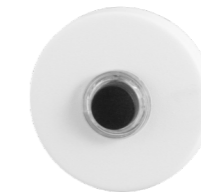
Belddrukker RVS, rond 50mm