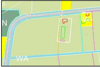
Afb. 1: Bestaande situatie