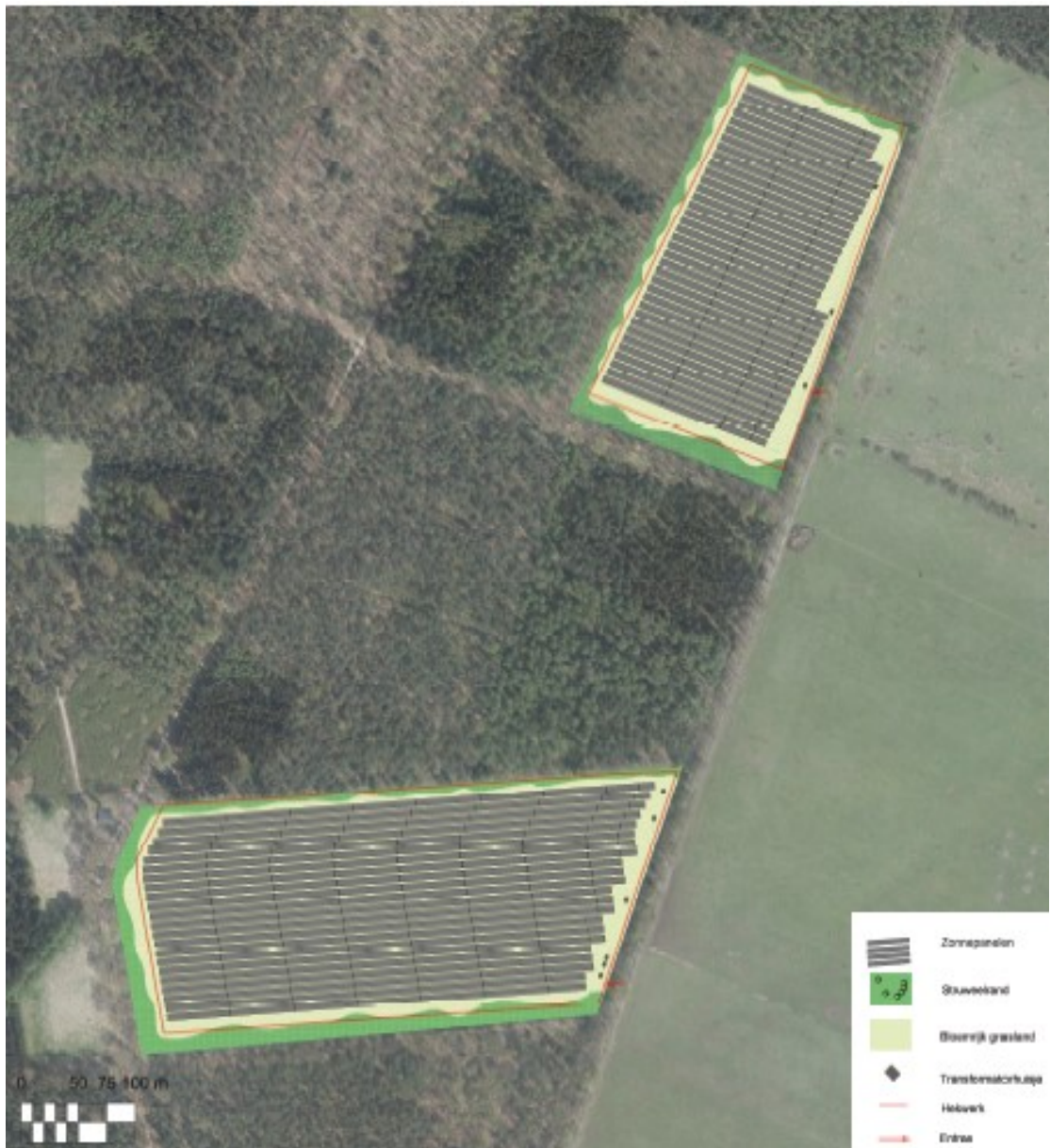
Figuur 3: Beoogde inrichting van het zonnepark met ligging zonnepanelen, struweelrand (lichtgroen), bloemrijk grasland (lichtgeel) en het aan te brengen hek (roodomlijnd).