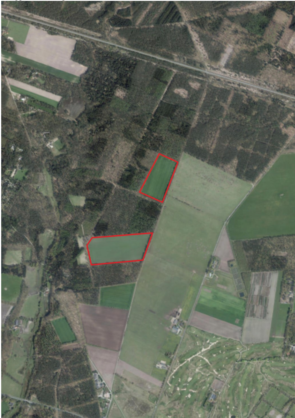
Figuur 2: Ligging op basis van luchtfoto van het plangebied (rode contouren) ten opzichte van omliggende natuurgebieden.