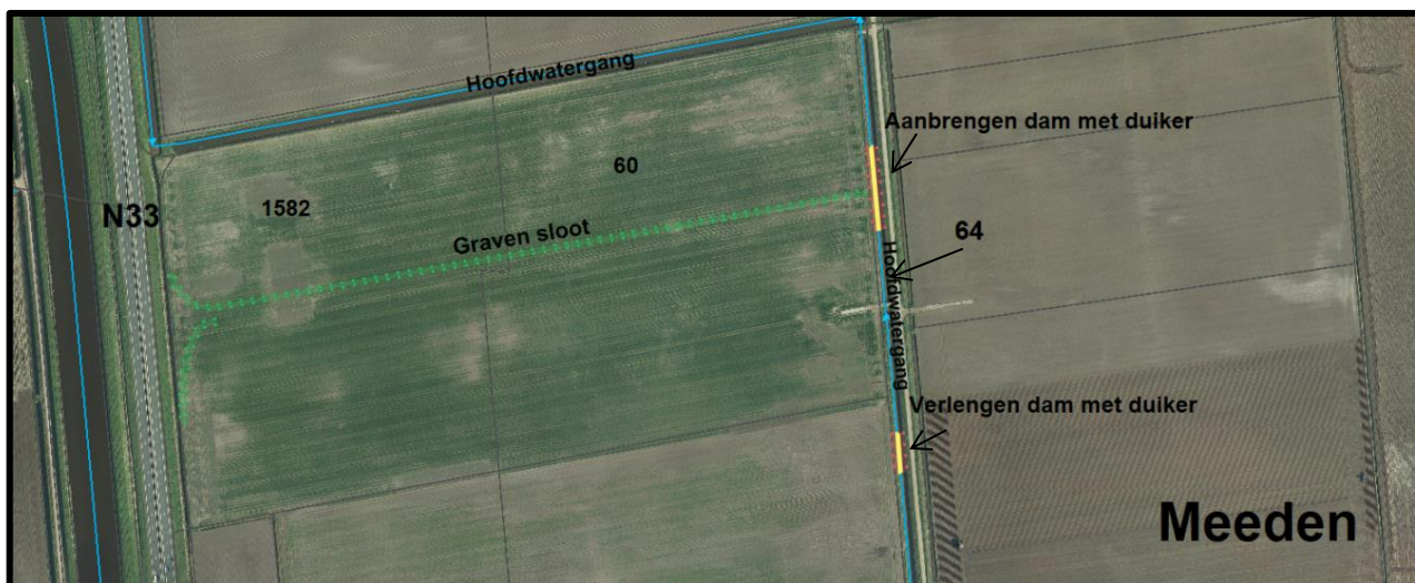
Luchtfoto 2: Zuidelijk gebied van het werkkerrein