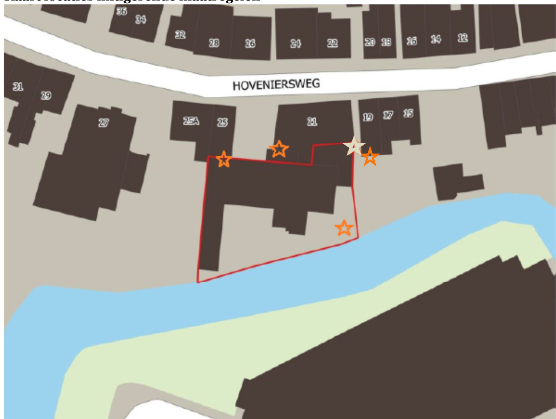
Figuur 2. Locaties tijdelijke vleermuiskasten (oranje ster) in het plangebied aan de Hoveniersweg te Tiel. De vleermuiskast op de locatie van de grijze ster wordt verplaatst in oostelijke richting.