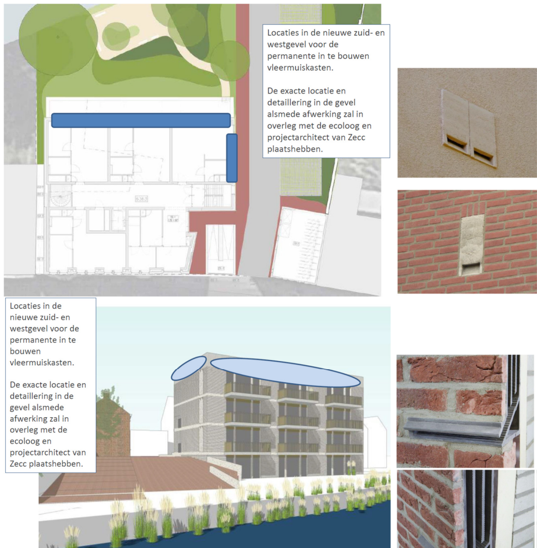
Figuur 3. Permanente voorzieningen (vleermuiskasten Schwegler 1 FR en Tichelaar VMK) en de locaties in de nieuwbouw in het plangebied Hoveniersweg te Tiel.