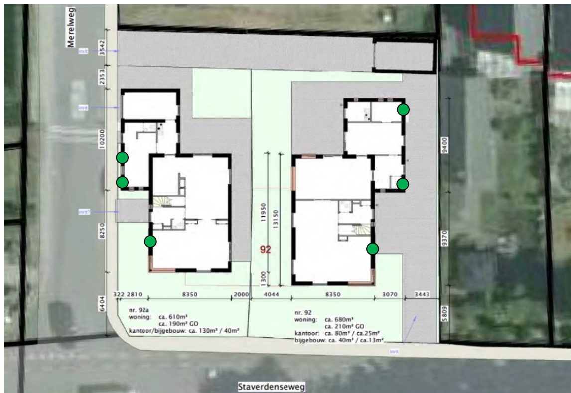
Figuur 3. Locaties permanente voorzieningen in de vorm van zes inmetelstenen in de nieuwbouw (groene stippen).