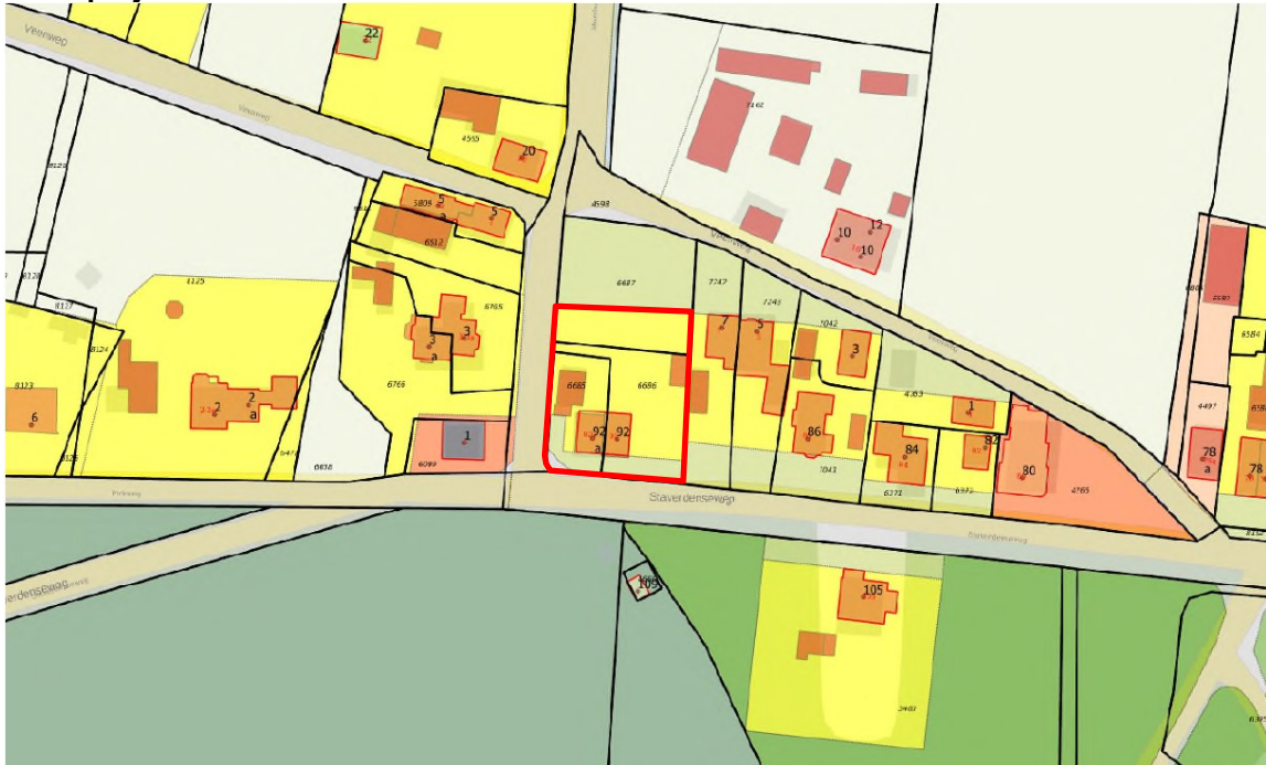
Figuur 1. Ligging plangebied Staverdensedweg 92 en 92a te Elspeet (rode kader)