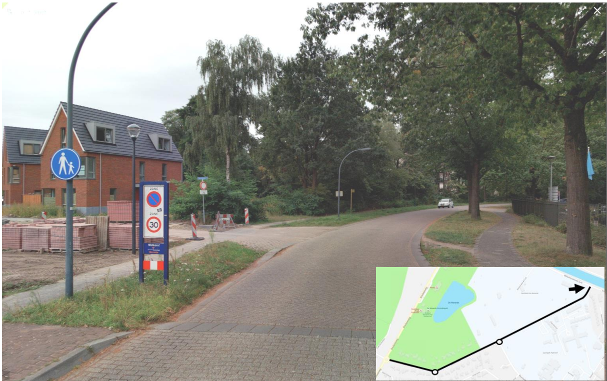
Afbeelding 5. Warandelaan bestaande sitautie (nabij aansluiting Wilhelminakanaal Zuid)