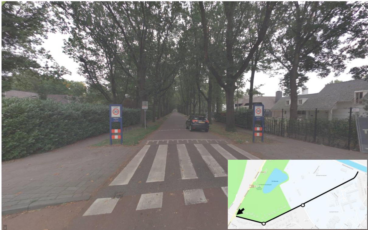
Afbeelding 1. Warandelaan bestaande situatie (nabij aansluiting Bredaseweg)

Behorende bij verkeersbesluit (JW 11-11-2019)