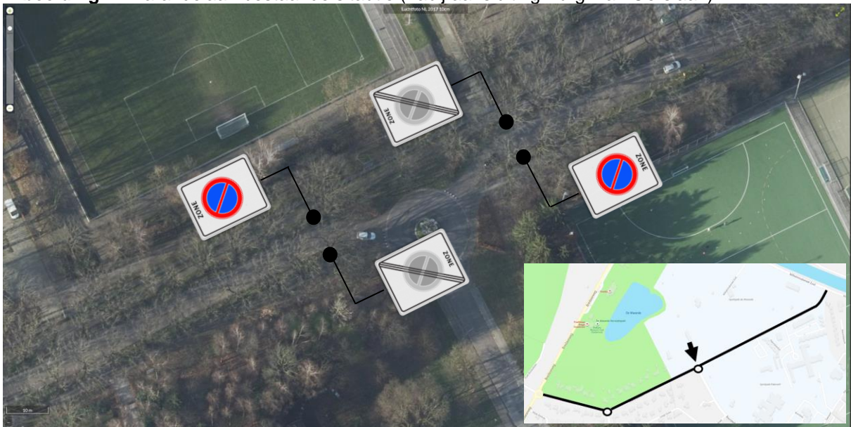
Afbeelding 3. Warandelaan nieuwe situatie (nabij aansluiting Buurstede)