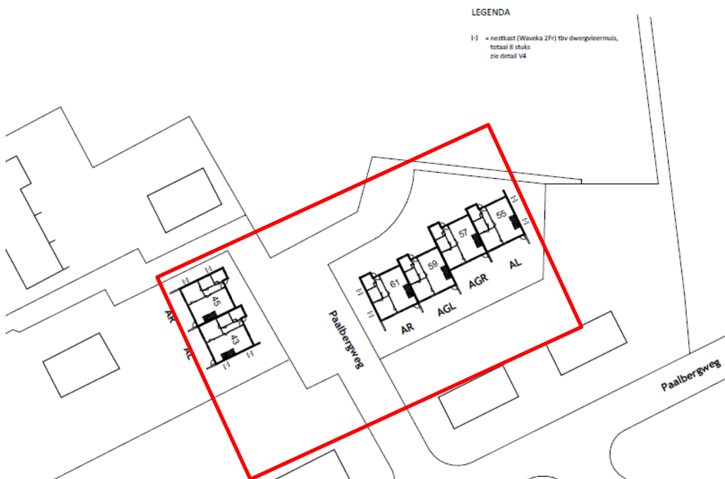
Figuur 2: Permanente vleermuisverblijven; [-] Schwegler 2FR binnen het plangebied (rood kader)