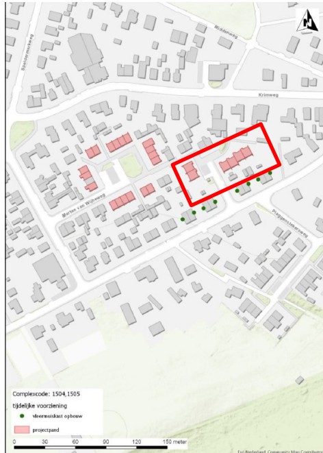
Figuur 1: Tijdelijke vleermuisverblijven; Schwegler 2FE (groene stippen) t.o.v. het plangebied (rood kader)