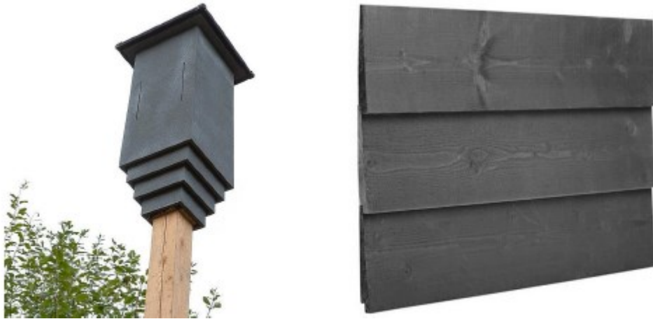
Figuur 5. Links Weergave vlermuizenpaalkast waarvan er twee worden geplaatst in het plangebied. Rechts, Gevelbetimmering met compartimenten van 3cm te plaatsen aan de muren loods en schuur golfbaan.