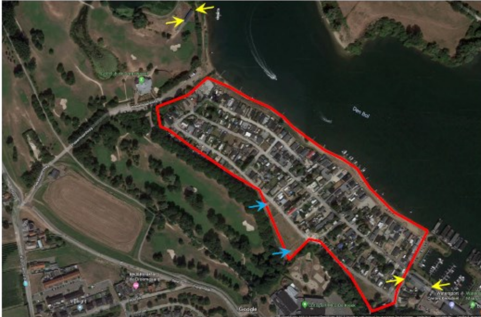
Figuur 7. Locatie plaatsing van de gevelbetimmering (gele pijl) en de twee vleermuizenpaalkasten (blauwe pijl).