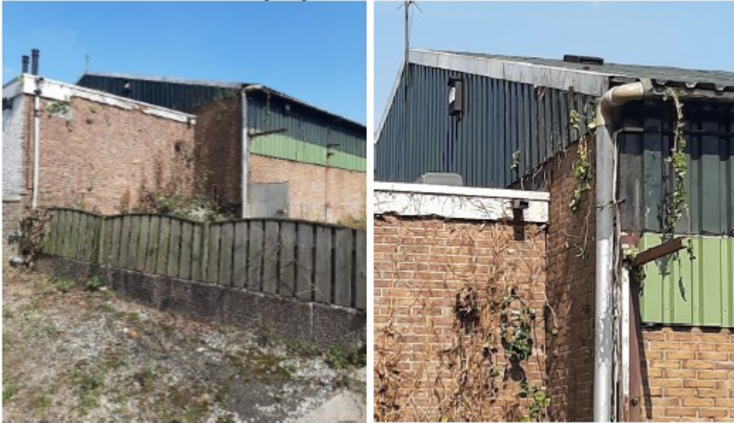
Figuur 3. Locatie geplaatste acht vleermuiskasten tegen de muren van de loods en vier op het dak.