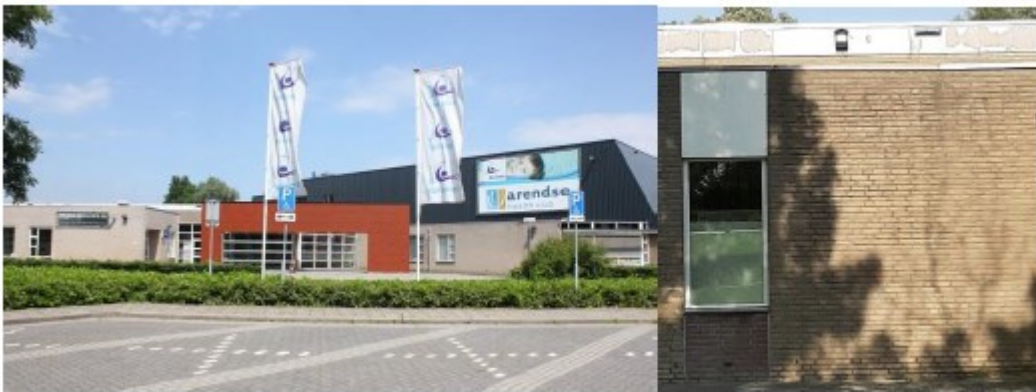
Figuur 4. Locatie geplaatste 16 vleermuiskasten aan het gebouw van sportvereniging MFC De Kreek.