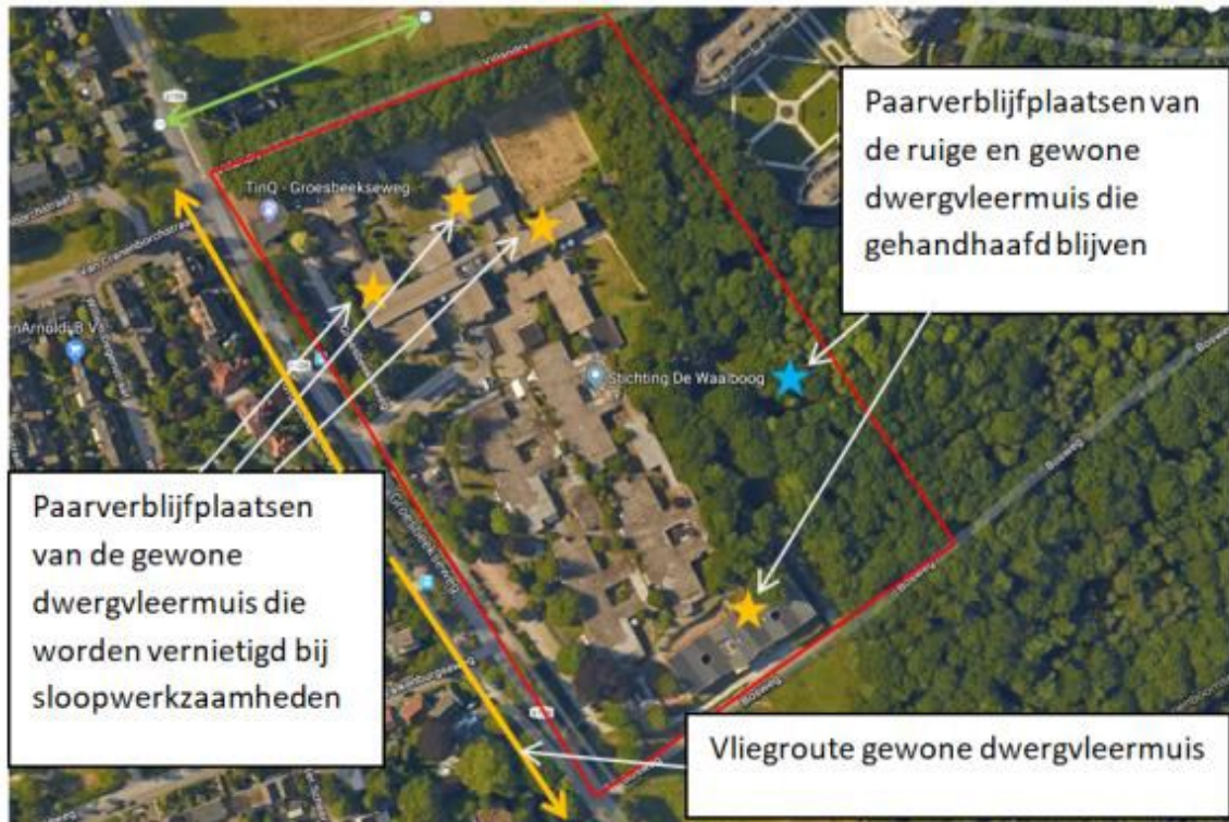
Bijlage 3: Aangetroffen verblijfplaatsen vleermuizen