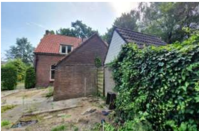
Figuur 1 – Foto aanzicht van een te slopen woning aan de Kolkmansweg

Op 18 juli 2019 heeft er aanvullend een quickscan plaatsgevonden in de tuinen van de woningen. De quickscan bestond uit een veldbezoek (18 juli 2019, 25°C, licht bewolkt en droog) en een bronnenonderzoek. In eerste instantie waren de onderzoeken gericht op de woningen omdat daar de ingrepen zouden plaatsvinden. In verband met de sloop is het aannemelijk dat ook de tuinen worden aangetast. De tuinen bestaan met name uit tegels en verwilderde planten (zie figuur hieronder). De tuinen zijn begrensd door hagen. Er zijn geen beschermde/ niet vrijgestelde planten, amfibieën, reptielen, grondgebonden zoogdieren of insecten waargenomen. Ook uit het bronnenonderzoek zijn geen relevante waarnemingen naar boven gekomen.