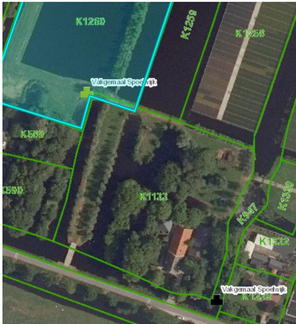
Afbeelding 3, kadastrale grenzen

Rijnland zal met de perceeleigenaar van kadastraal perceel BKP00 K 1133 een recht van weg overeenkomst afsluiten ten behoeve van het menggranulaatpad naar het gemaal.