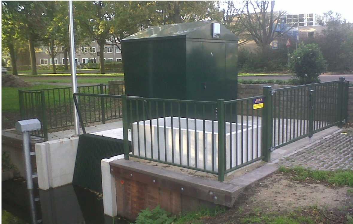
Afbeelding 4: Soortgelijk gemaal

Afbeelding 4 toont een soortgelijk gemaal als het toekomstige gemaal