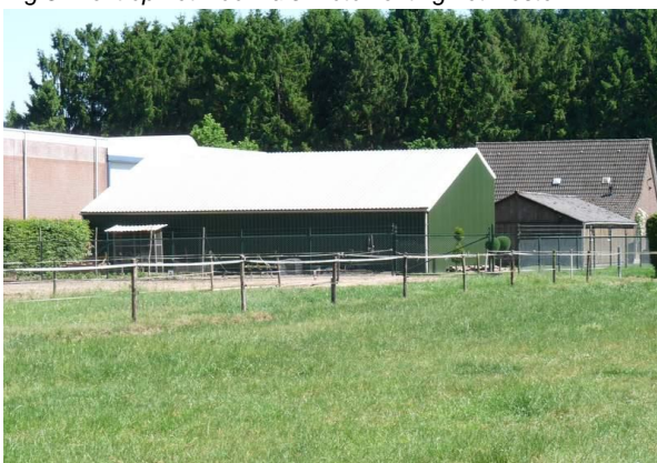
Fig. 5. Zicht op de veldschuur tussen de paardenwei en het woonhuis. Foto genomen richting het zuiden.