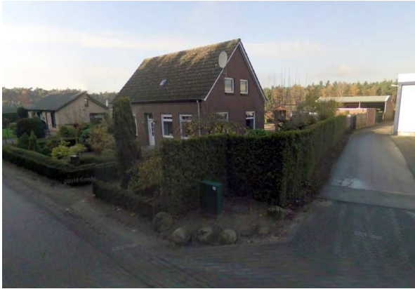
Fig 3. Zicht op het woonhuis. Foto richting het westen.