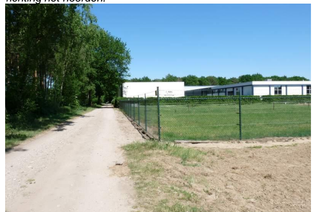
Fig. 8. Hekwerk rondom de paardenwei.