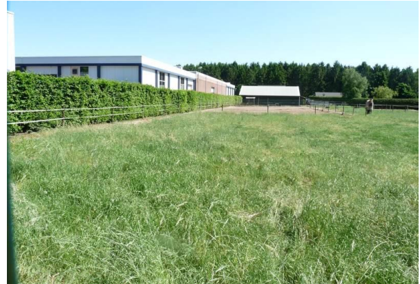
Fig. 4. Zicht op de paardenwei. Foto richting het zuidoosten.