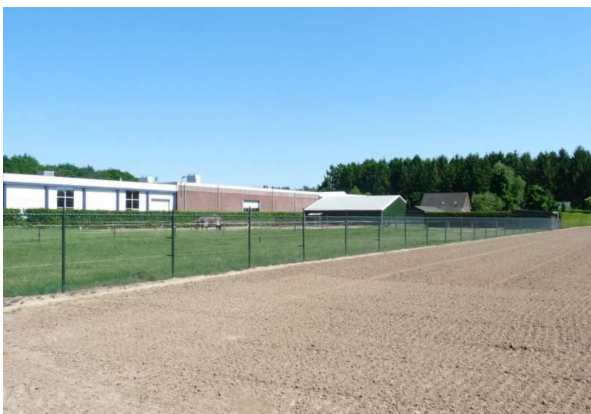
Fig. 7 hekwerk rondom de paardenwei.