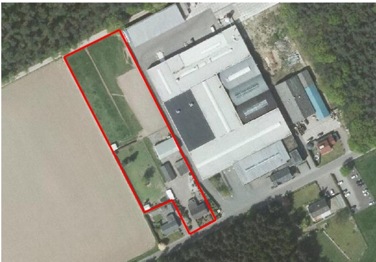
Figuur 1: Luchtfoto plangebied en omgeving, met het plangebied rood omlijnd.

Het plangebied is gelokaliseerd in het buitengebied, halverwege tussen Lottum en Grubbenvorst. De Amersfoortcoördinaten van het midden van het plangebied zijn X= 200.192, Y= 385.061. Het plangebied is rood omkaderd weergegeven op de luchtfoto (figuur 1) en weergegeven als een rode ster op de topografische kaart (figuur 2).