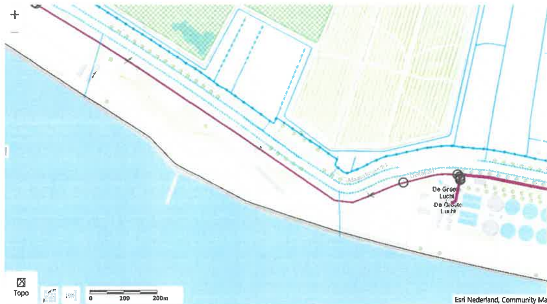
Afbeelding: Indicatieve ligging afvalwatertransportleiding (paarse lijn)

Evenwijdig aan de Delflandsedijk ligt een afvalwatertransportleiding van AWZI De Grote Lucht. De twee windturbines staan op ca. 5 meter van deze persleiding.