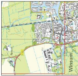
Overzicht schaal 1:24.000