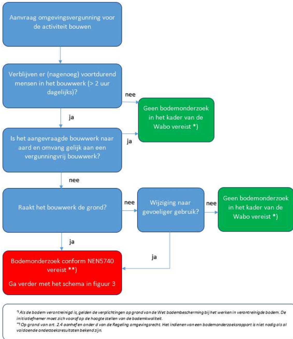
Figuur 2: Bodemonderzoeksplicht bij de omgevingsvergunning voor de activiteit bouwen.