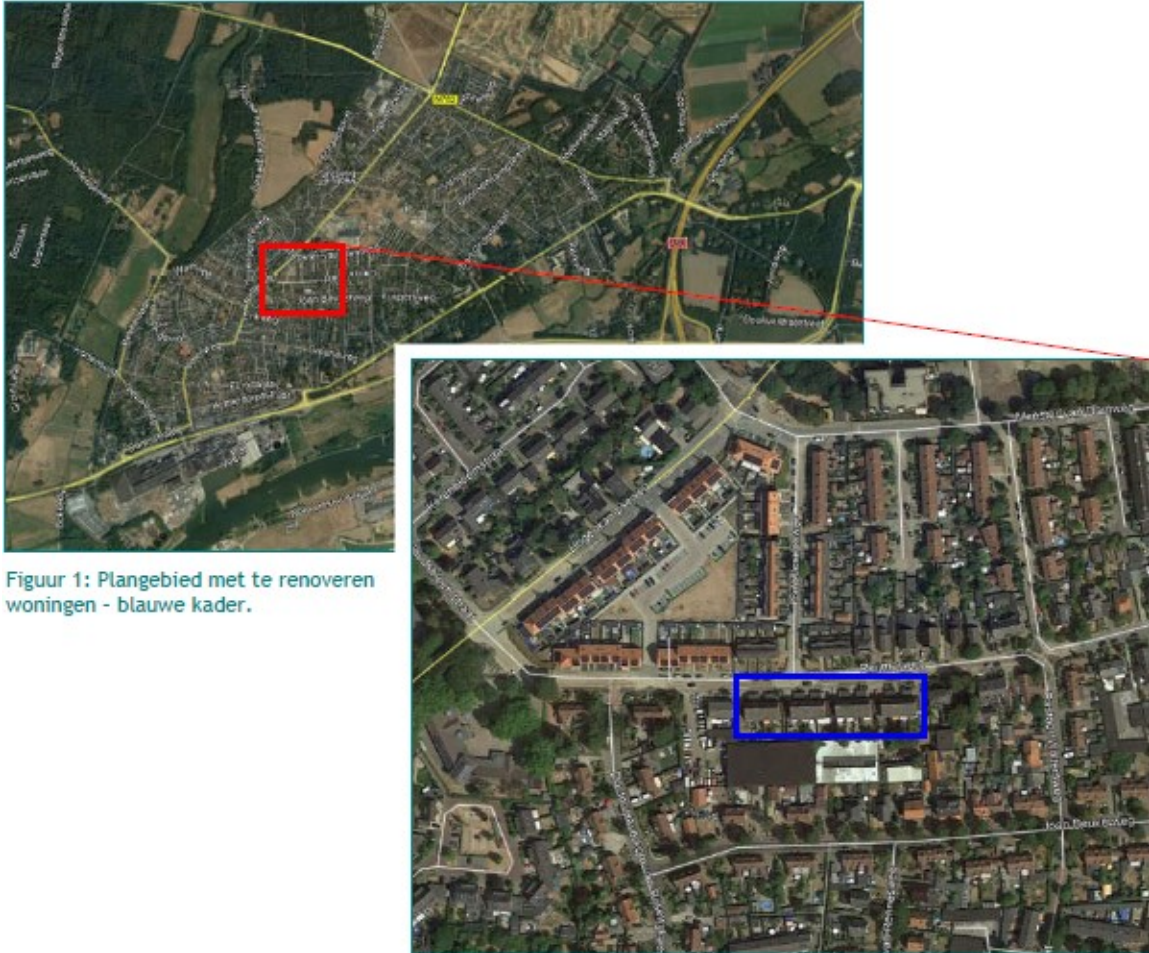
Figuur 1: Plangebied met te renoveren woningen - blauwe kader.