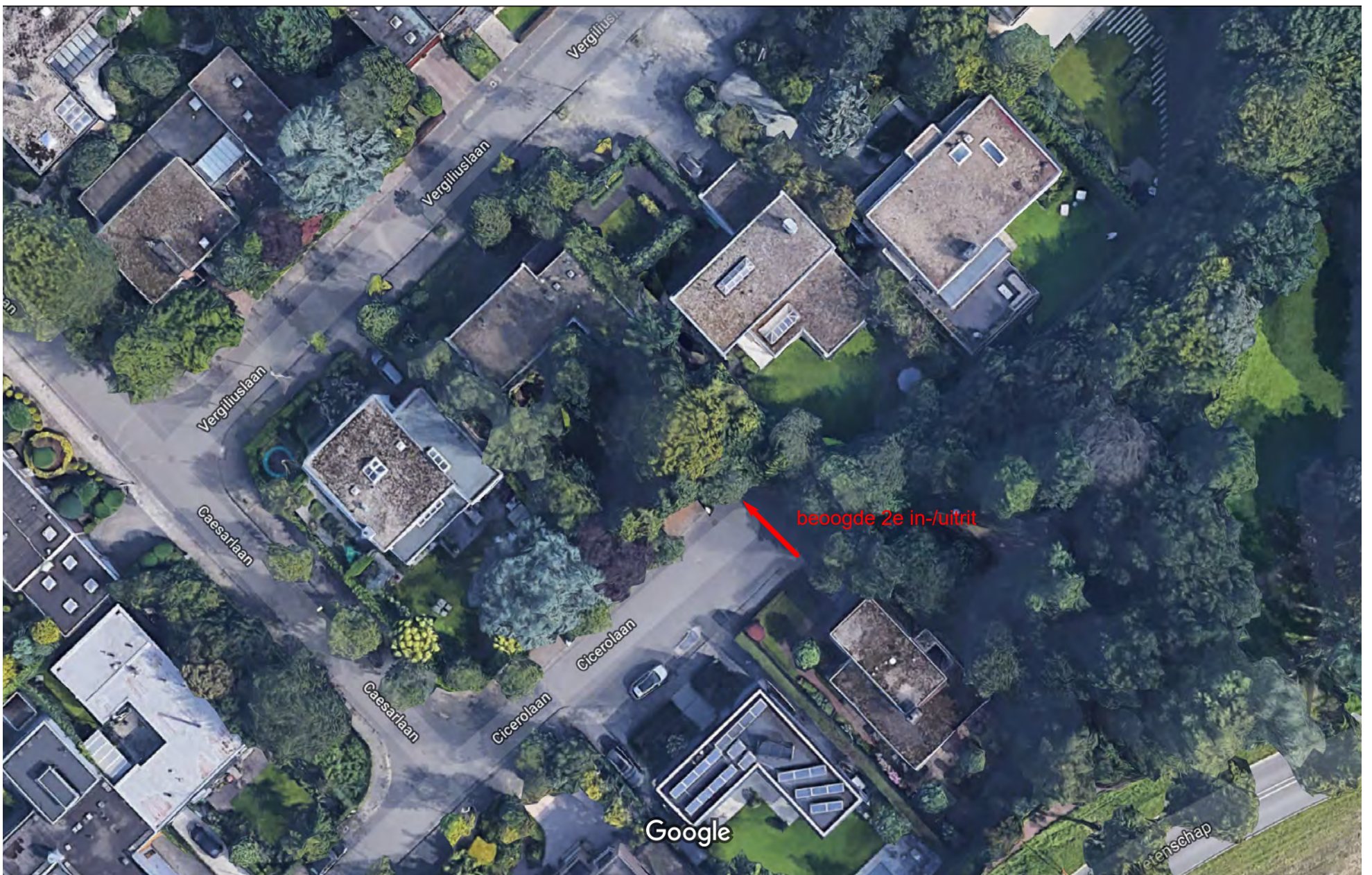
SITUATIE luchtfoto 2D