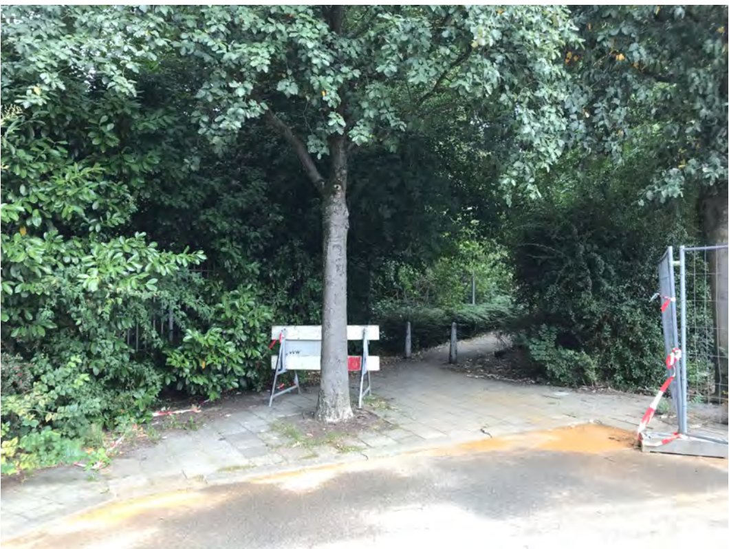
SITUATIE foto's bestaande situatie