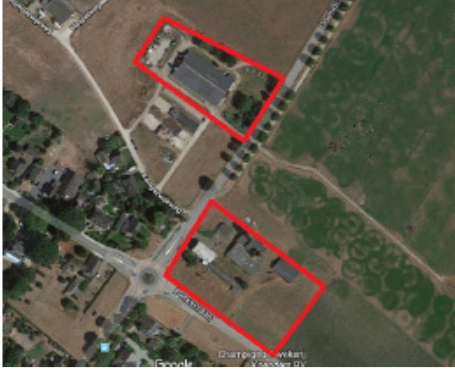
Figuur 2: Kaart mitigerende maatregelen buiten projectlocatie. Onderste rood kader is projectlocatie. Bovenste rood kader betreft locatie waar steenuil- en kerkuilkasten geplaatst zijn begin februari 2019.