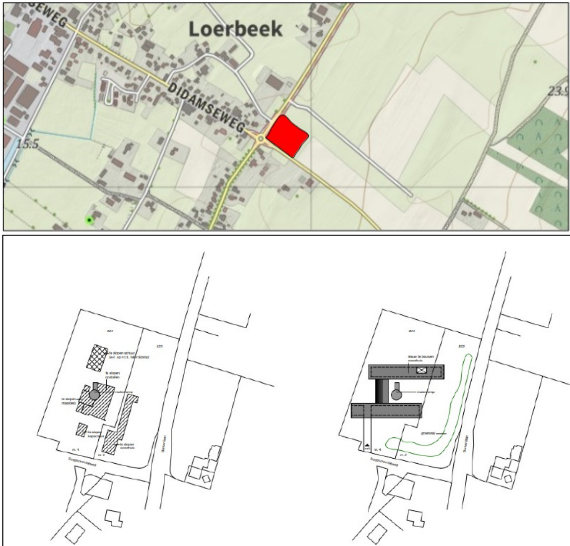
Figuur 1: Bovenste afbeelding topografische ligging plangebied, onderste afbeelding links de oude situatie, rechts nieuwe situatie