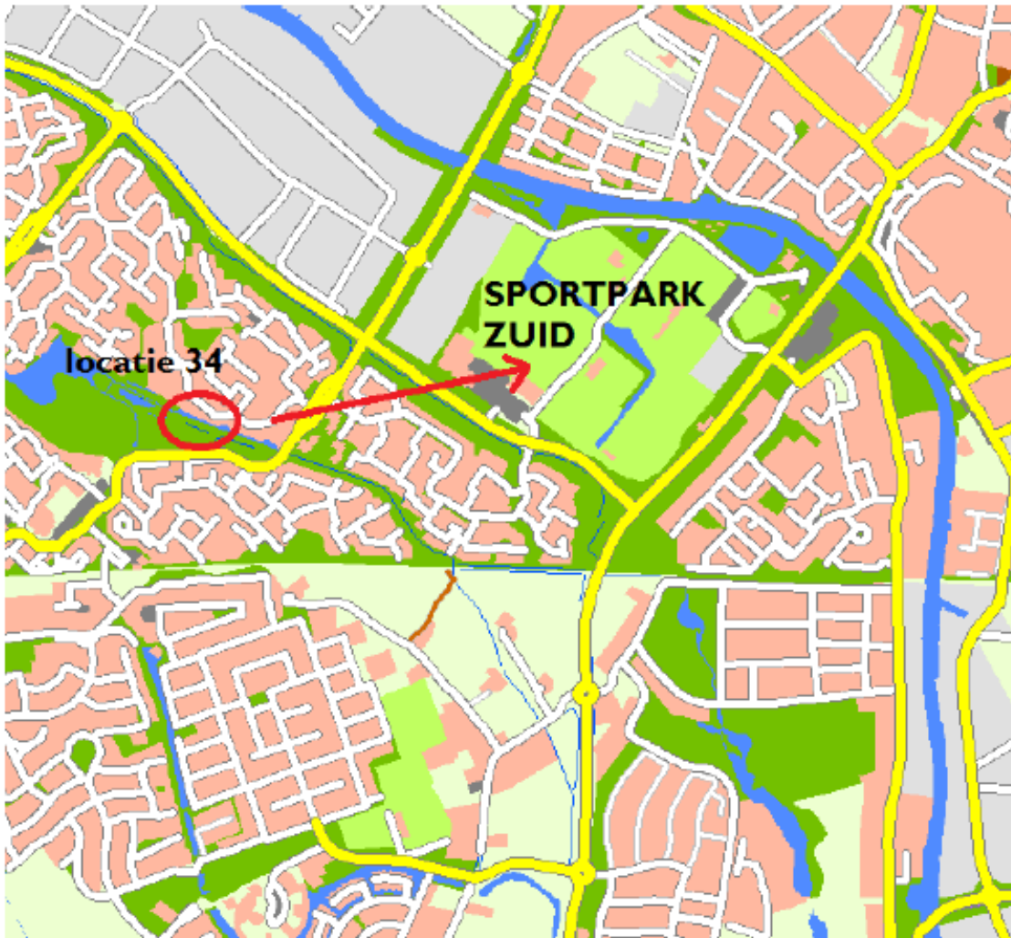
Figuur 2 De 7 nesten van de roek worden verplaatst naar de locatie Sportpark Zuid.

Kaart locatie van de te verplaatsen nesten van de roek