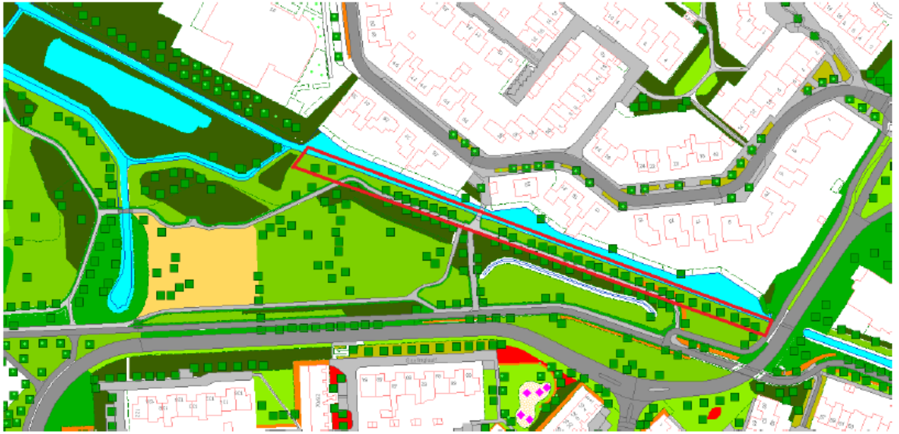
Figuur 1 Plangebied (rood omkaderd)