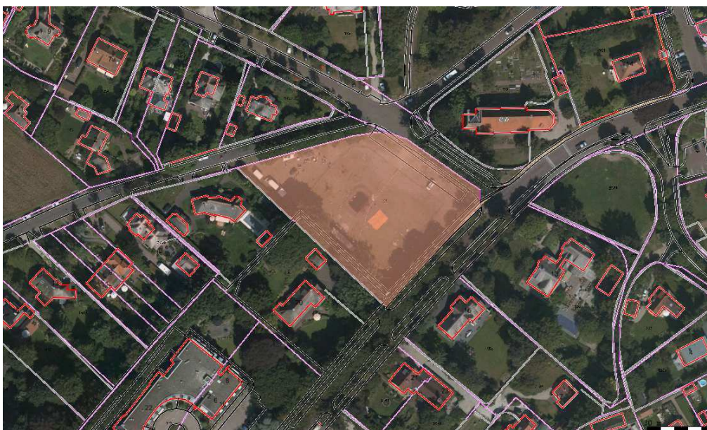
D 168 (Oranjewitje). Oppervlakte 4340 m 2