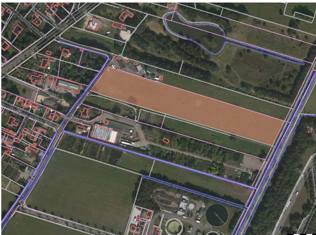
B 3660 Woonwagens.Oppervlakte 13100 m 2