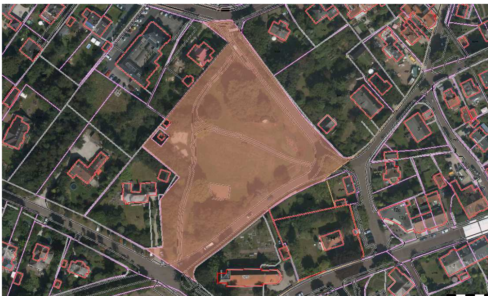
D 1531 (Pieperspark). Oppervlakte 10181 m 2