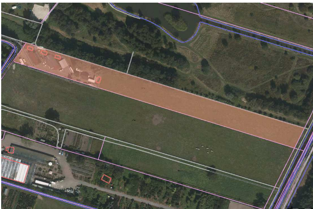
B 3628 Woonwagens . Oppervlakte 6360 m 2