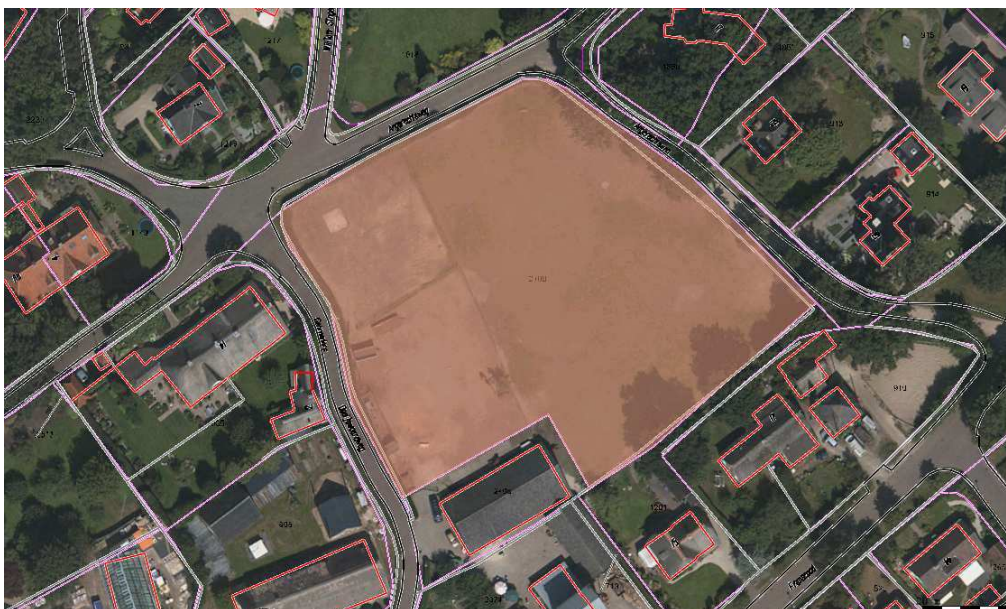
E 2409 (grasland); hoek Angerechtsweg/ Dooijewaardweg. Oppervlakte 6035 m 2