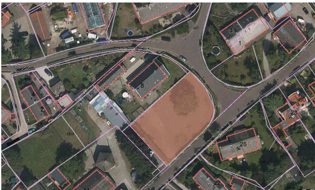
E 2309 (grasland); naast Binnenweg 8. Oppervlakte 1020 m 2