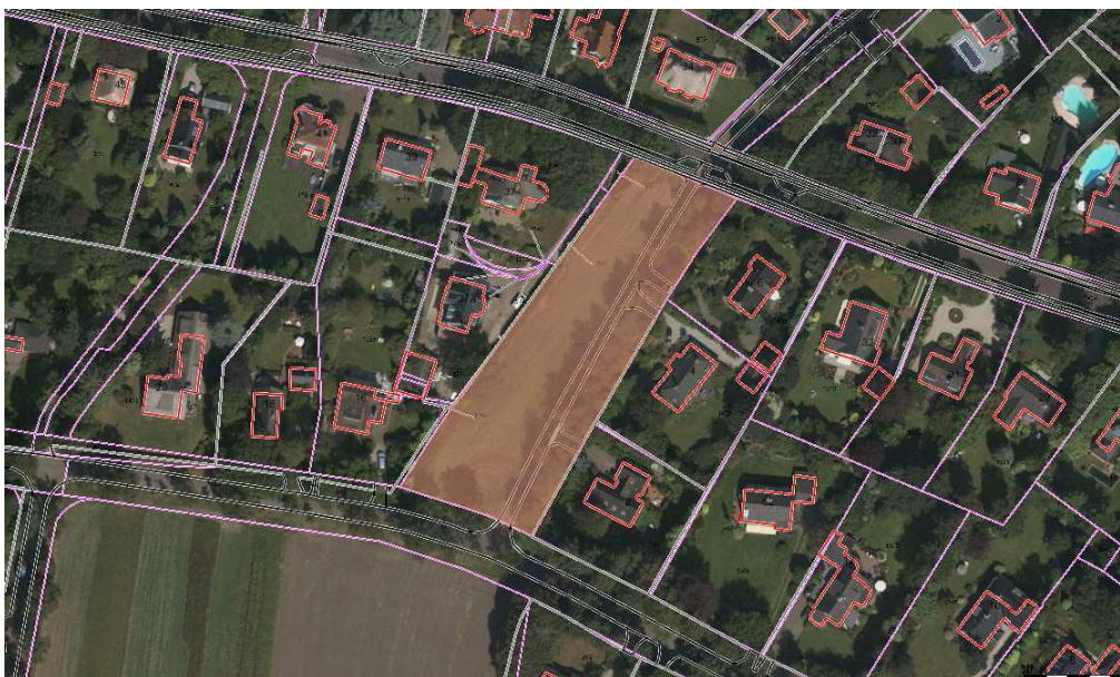
D 1405 (grassland) Naast Naarderweg 37. Oppervlakte 3700 m 2