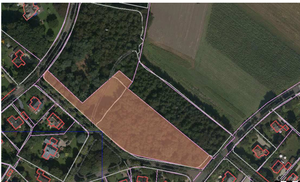
D 997 (bosgebied met wadi); Eng Noolseweg. Oppervlakte 6414 m 2