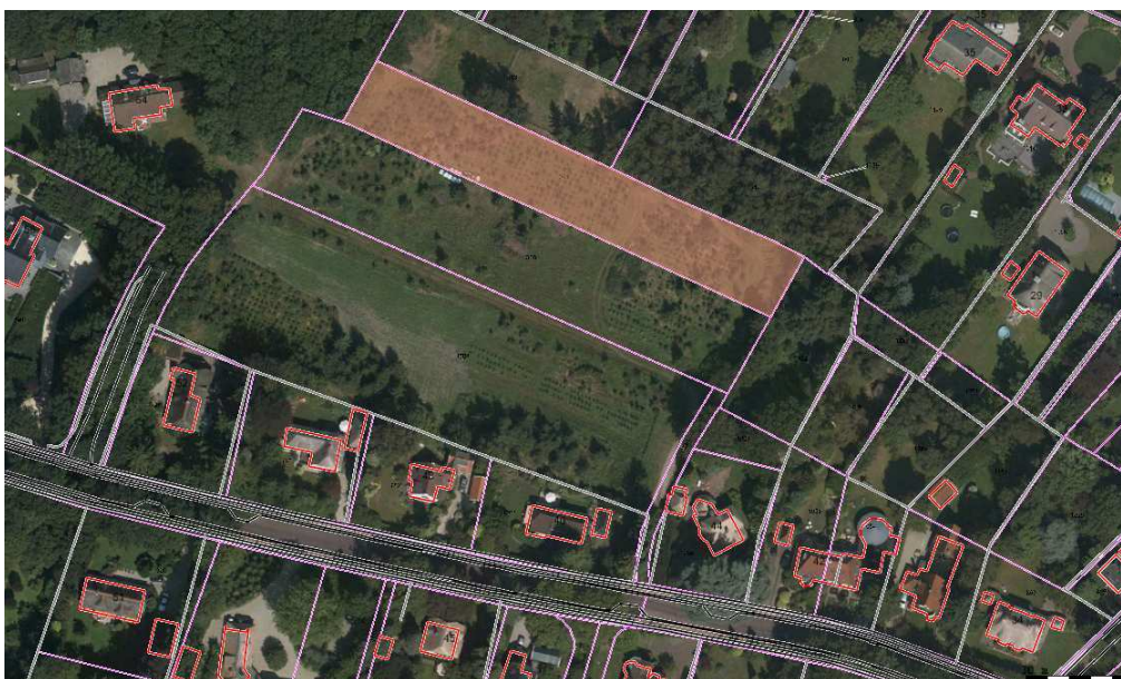
D 361 (grasland); Kerstbomenakker Naarderweg . Oppervlakte 2310 m 2