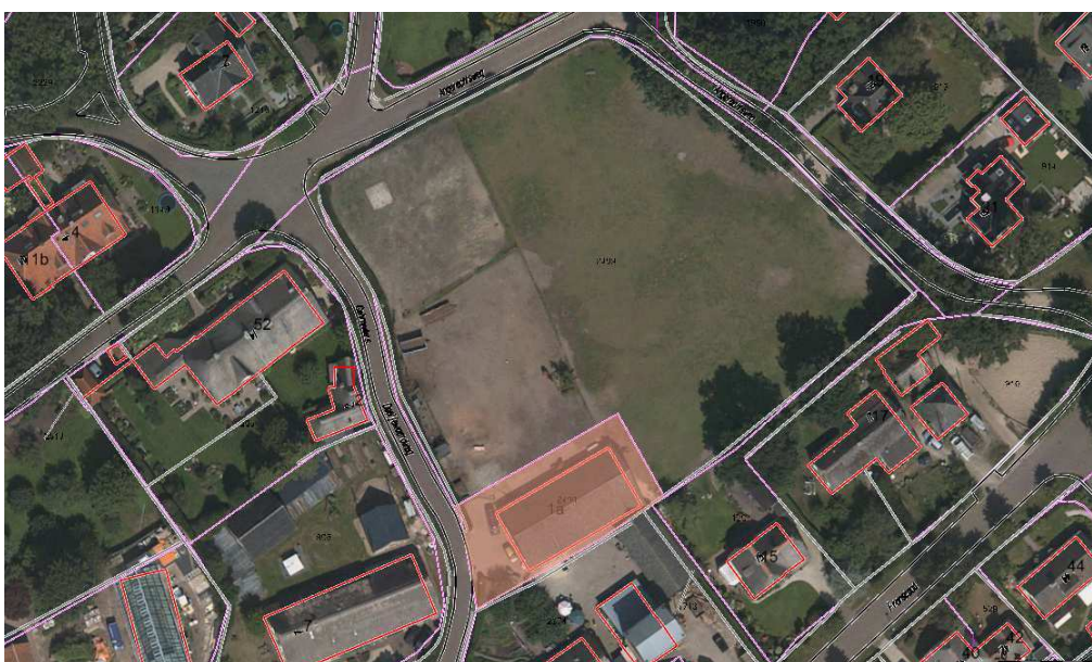
E 2408 (grasland met bebouwing); Gebr. Dooijewaardweg 1a. Oppervlakte 710 m 2