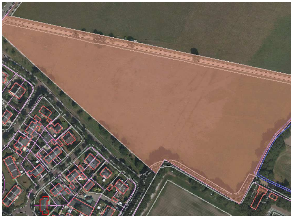
C 750 Meentzoom sportpark. Oppervlakte 28250 m 2