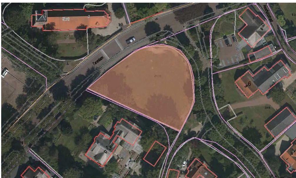
E 2638 (grasland); naast Torenlaan 13. Oppervlakte 1580 m 2