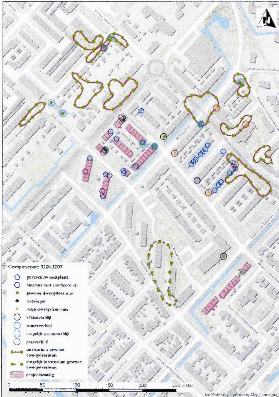
Figuur 1 Verblijfplaatsen aangetroffen beschermde soorten. Voor de rode woningen wordt ontheffing aangevraagd (complex 3204 en 3207).