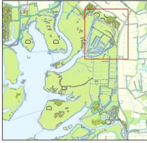
Overzicht schaal 1:100.000