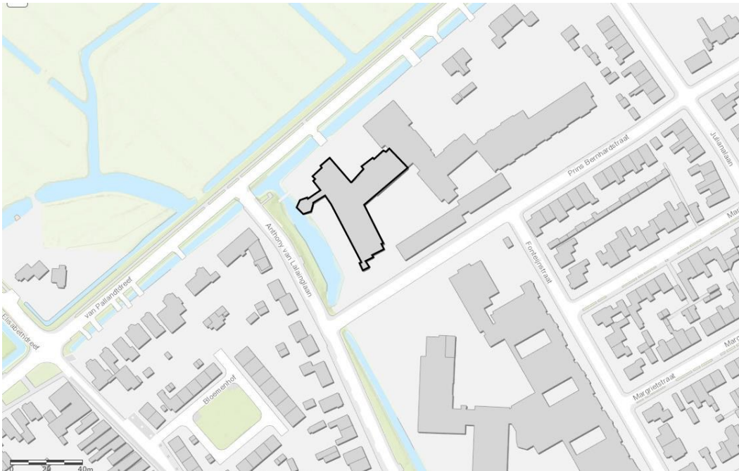
Figuur 1. Ligging plangebied aan de Van Pallandtsteeg 10 te Culemborg, met zwart omlijnd de in twee fasen te slopen bebouwing.