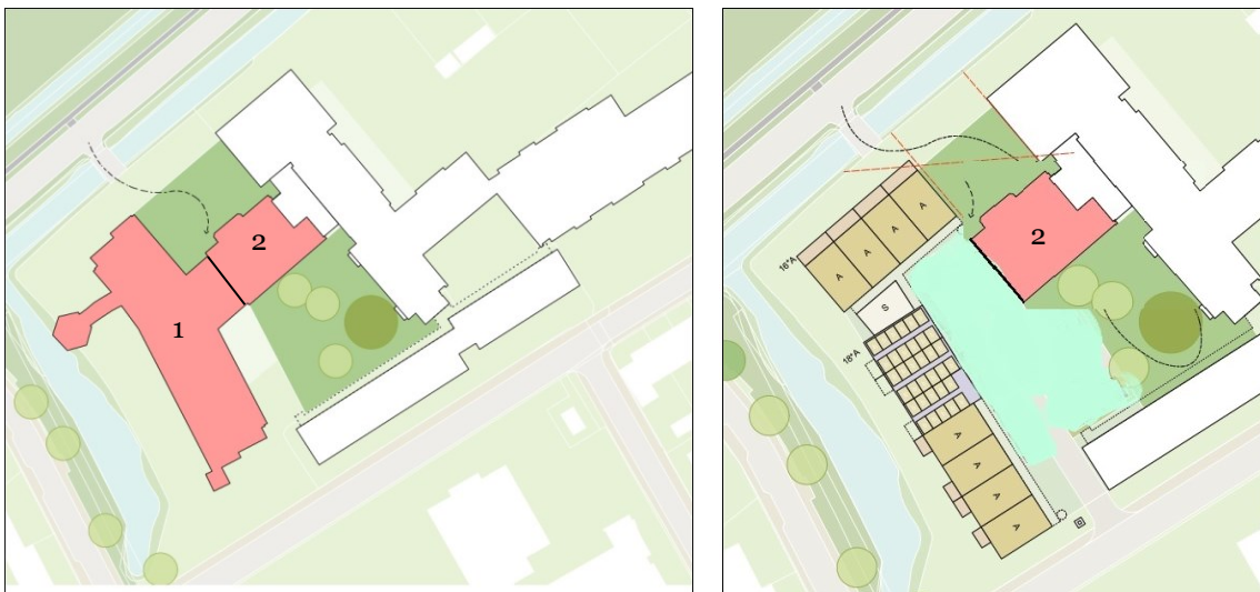
Figuur 2. Fasering sloop: Links het geheel te slopen gebouw fase 1 en 2; rechts het nog te slopen deel voor fase 2 (middendeel) en de nieuwbouw met parkeerplaatsen.