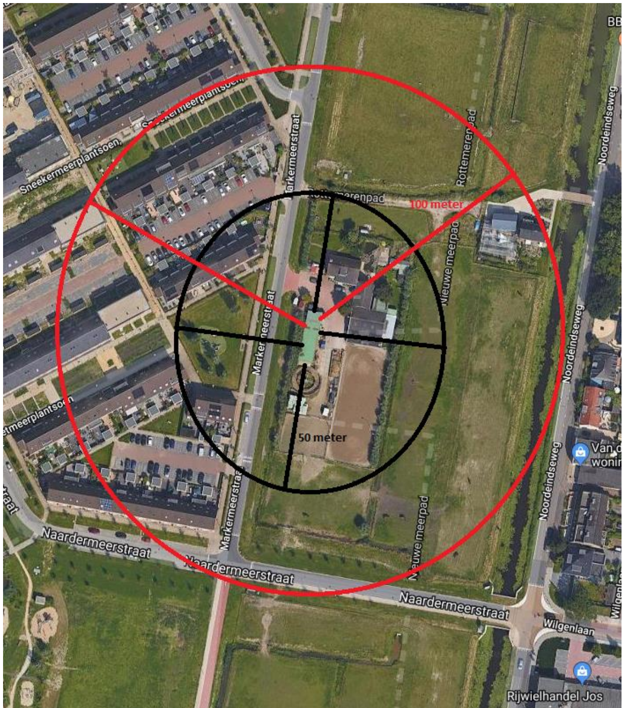
Figuur 3. Afstanden vanaf het dierenverblijf.