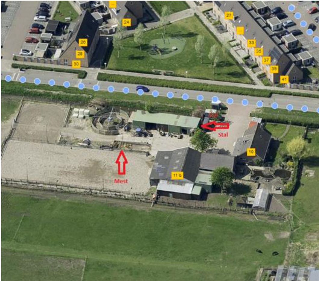
Figuur 4. Overzicht terrein met stal en mestopslag

De op het terrein gelegen opslag van vaste mest is niet te koppelen aan de geurverordening. Hiervoor gelden de regels uit het Activiteitenbesluit en is een geurcirkel voor het emissiepunt van de mestopslag niet aan de orde. Voor de ontwikkeling van de woonwijk moet in de ruimtelijke onderbouwing worden gemotiveerd dat de mestopslag geen invloed heeft op een goed woon- en leefklimaat. Hierbij speelt dat de opslag al aanwezig was voor 1 januari 2013 en er al woningen aanwezig zijn op kortere afstand van de mestopslag (circa 45 meter). De beoogde ontwikkeling voor nieuwbouw ligt op circa 70 meter. Eventueel kan de gemeente op basis van het Activiteitenbesluit maatregelen stellen aan de voorziening om geurhinder te voorkomen (art. 3.46, lid 3b).