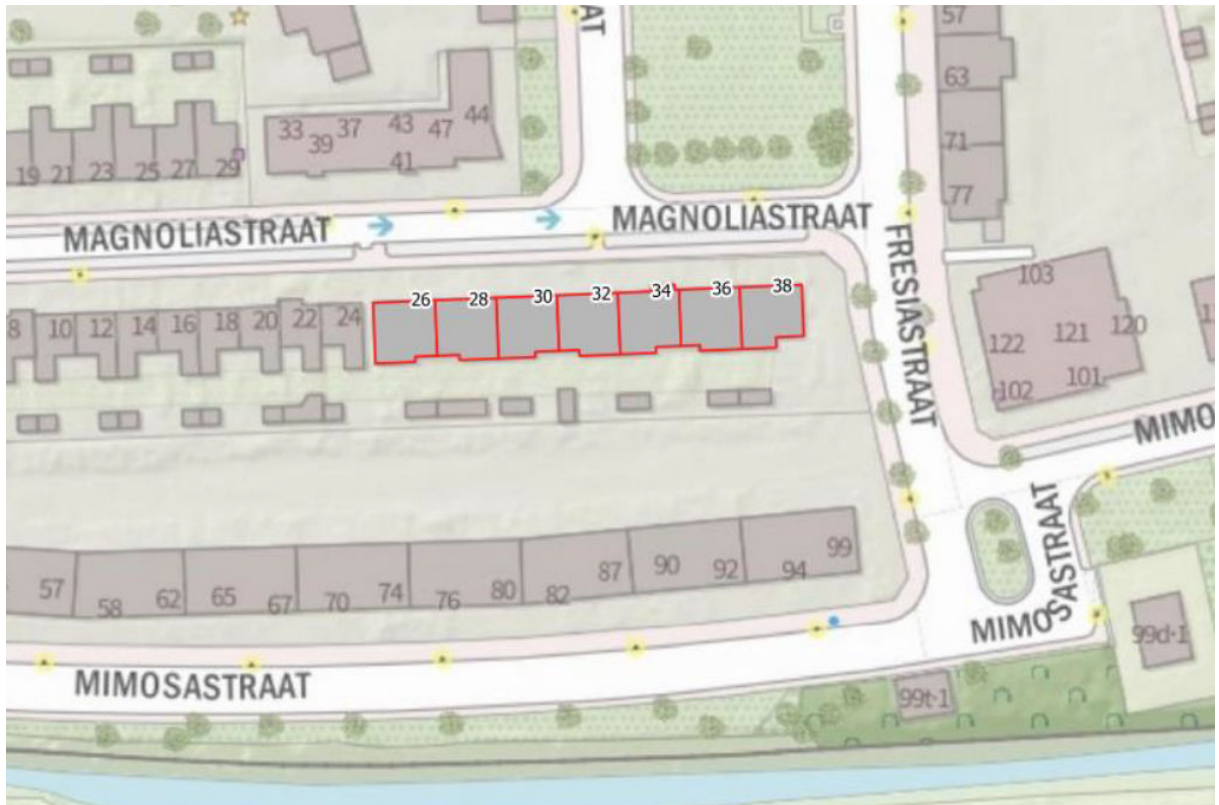
Figuur 1. Ligging te renoveren woningen Magnoliastraat 26-38a

SWZ heeft het voornemen om bij complex 208 groot onderhoud uit te voeren door energetische maatregelen te treffen. De aanvraag betreft 16 duplexwoningen (bouwjaar 1951) gelegen aan de Magnoliastraat 26 t/m 38a in de wijk 'Assendorp' te Zwolle.