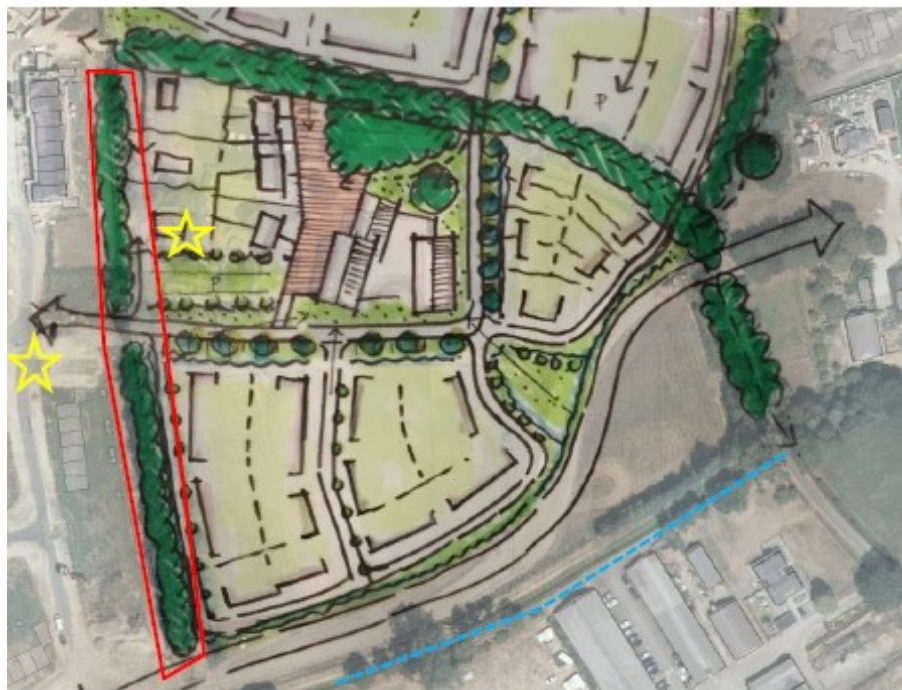
Figuur 2 Globale ligging locatie garage (rechtse gele ster) en globale ligging nieuwbouwwoningen met alternatieve voorzieningen (linkse gele ster, eigenlijk verder naar links buiten afbeelding). Zie bijlage 3 voor de specifieke ligging. Het rood kader betreft de groene zone, verbindend naar reeds bestaande algemene vliegroute (blauwe lijn). Binnen 200 meter van het plangebied dienen daarnaast 2 extra kopgevels geschikt gemaakt te worden enkel gericht op laatvlieger.