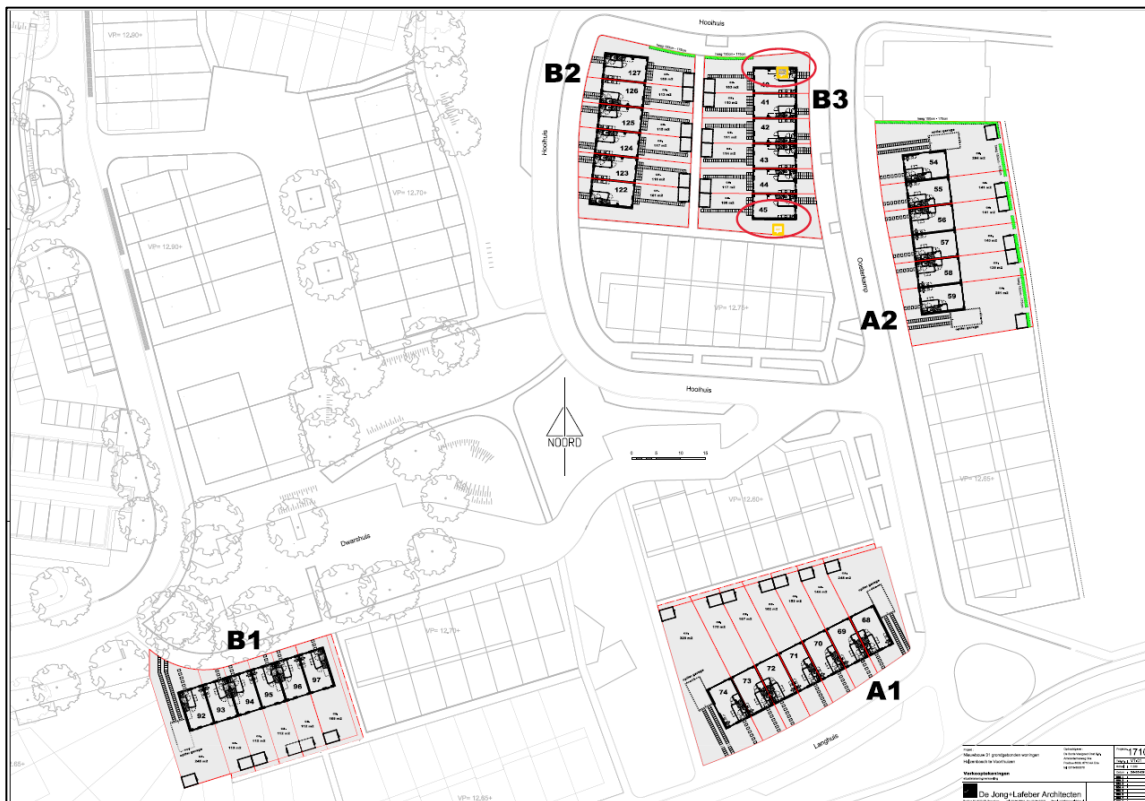
Figuur 4 Locatie van geschikte gevels voor vleermuizen in nieuwbouw (Rode cirkels). Afmeting alternatieven Woningen: de diepte van de houten betimmeringen in de kopgevels is 31 mm. De breedte en hoogte van deze betimmeringen zijn circa 80 cm. Per kopgevel komen 2 van dergelijke betimmeringen, 4 in totaal. Elke 'gevelkast' krijgt toegang via twee open stootvoegen van 2,5 cm breed. Als extra voorschrift is opgenomen dat deze een lengte van minimaal 5 cm dienen te hebben.

Binnen 200 meter van het plangebied dienen 2 extra kopgevels geschikt gemaakt te worden als verblijfplaats enkel gericht op laatvlieger. De te realiseren verblijfplaatsen dienen minimaal gelijk te zijn aan de type verblijfplaatsen die reeds gerealiseerd zijn in de nieuwbouw ten westen van het plangebied, maar dan met enkel toegankelijke open stootvoegen voor de laatvlieger van 2,5-3 cm breed en een lengte van minimaal 5 cm. Bij voorkeur wordt de gehele luchtspouw toegankelijk voor de soort. Daarnaast dient van diezelfde kopgevels waar de voorzieningen in de toekomst getroffen worden de gevelpannen en houten betimmering geschikt gemaakt te worden als verblijfplaats voor de laatvlieger.