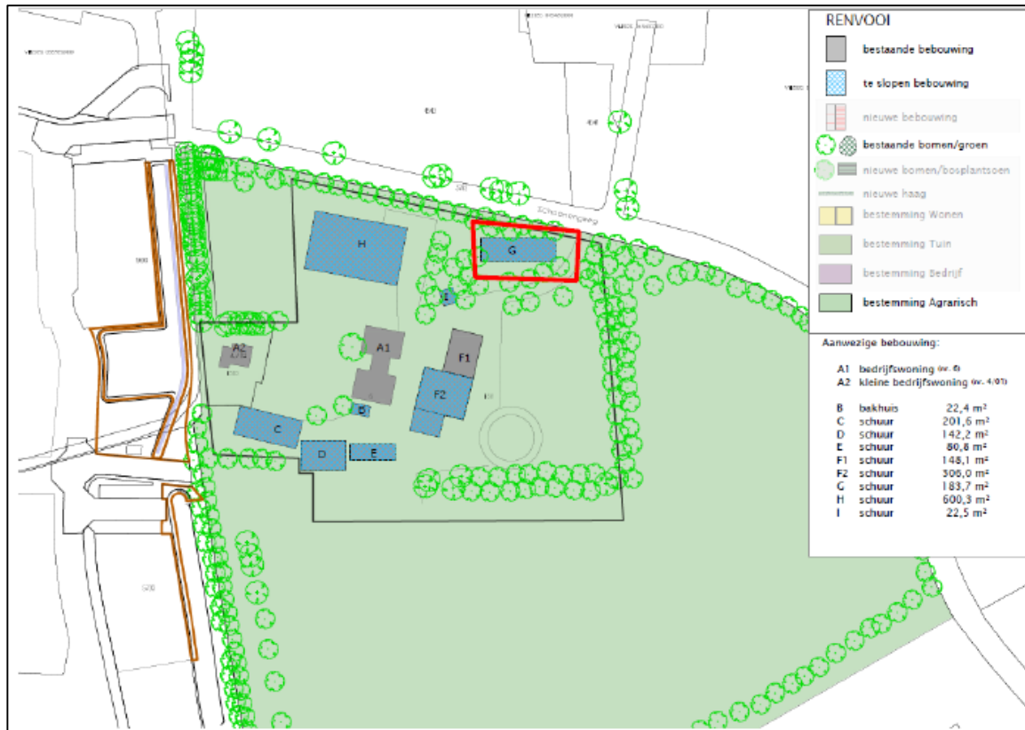
Figuur 1 Te slopen schuur (opstal G, rood omlijnt).