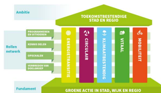
Figuur 1 EGC

De thema's energie, klimaatbestendig, circulair, mobiliteit en vitaal worden ondersteund door de Sustainable Development Goals. In alle fasen van het inkoopproces worden de effecten op people (mensen), planet (planeet/milieu) en profit/prosperity (winst/welvaart) meegenomen.