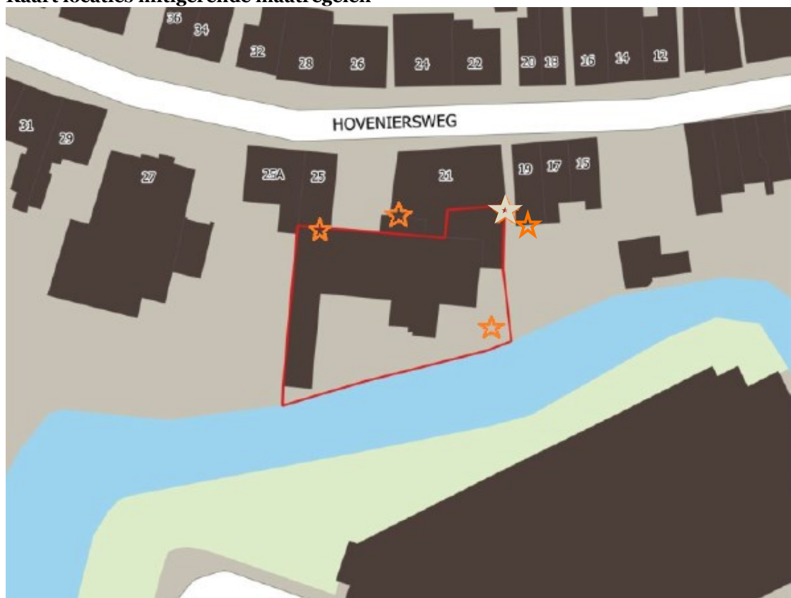
Figuur 2. Locaties tijdelijke vleermuiskasten (oranje ster) in het plangebied aan de Hoveniersweg te Tiel. De vleermuiskast op de locatie van de grijze ster wordt verplaatst in oostelijke richting.