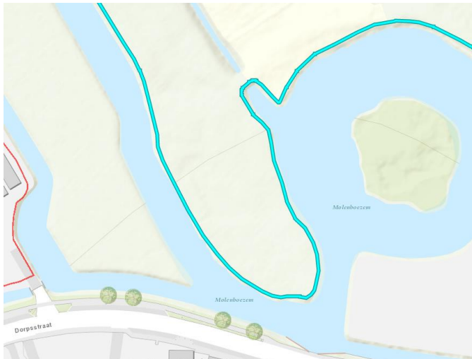
Figuur 1: projectgebied met huidige legger

De kade ligt op een perceel dat in particulier eigendom is. Er is geen noodzaak tot grondverwerving.