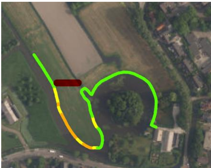
Figuur 3: visualisatie hoogte kade

In overleg met de perceeleigenaar is besloten om de kering te verleggen naar het hoge gedeelte. In figuur 3 is de nieuwe leggerlijn met de kleur rood aangeduid. Hierdoor is het niet meer nodig om de kade fysiek op te hogen. Een toekomstige verbetering van de kade is hierdoor bovendien efficiënter uit te voeren.