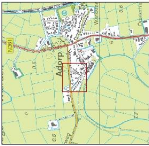
Overzicht schaal 1:18.000