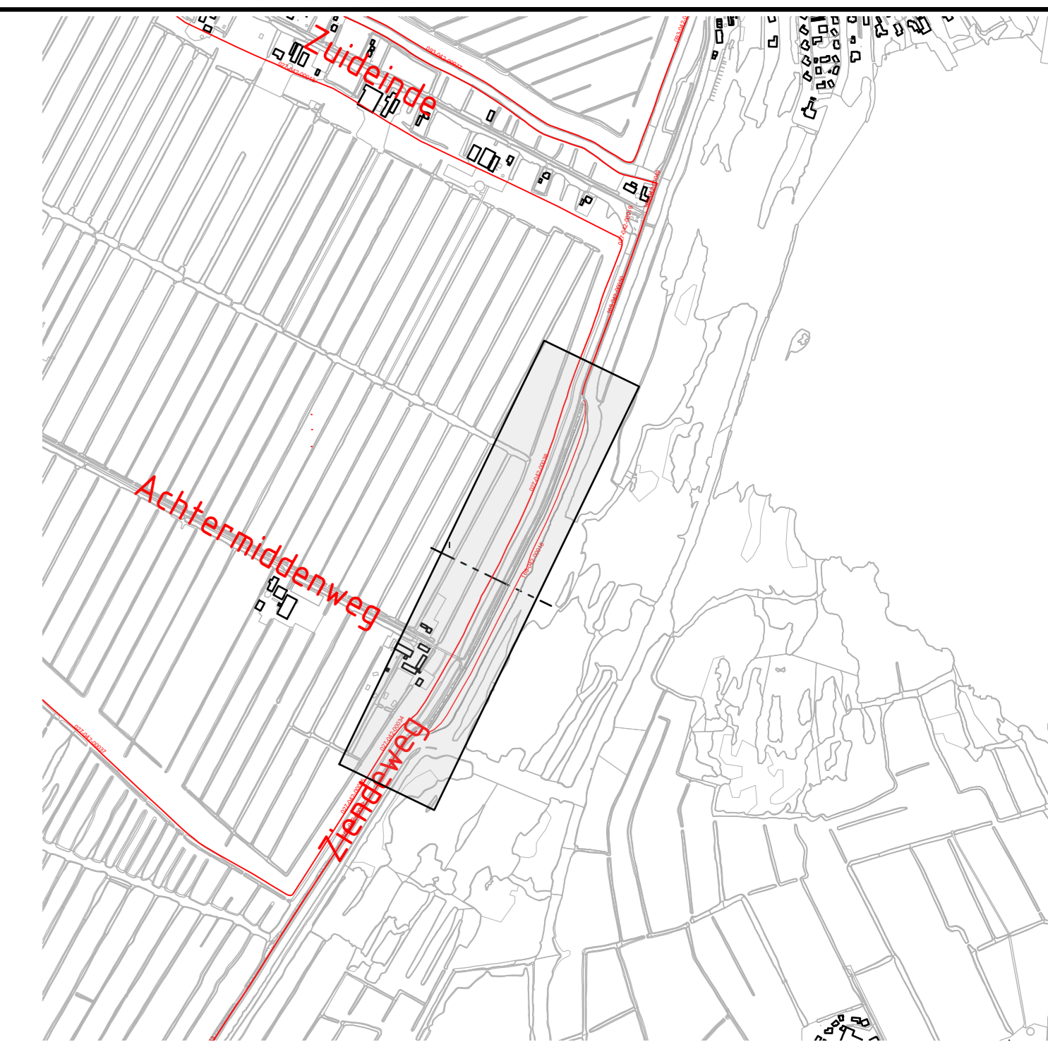
Situatieverzicht Schaal 1:10.000