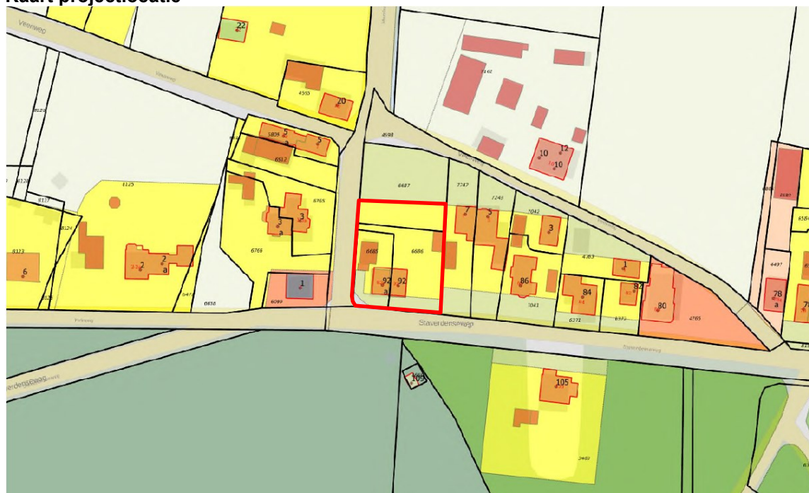
Figuur 1. Ligging plangebied Staverdenschweg 92 en 92a te Elspeet (rode kader)