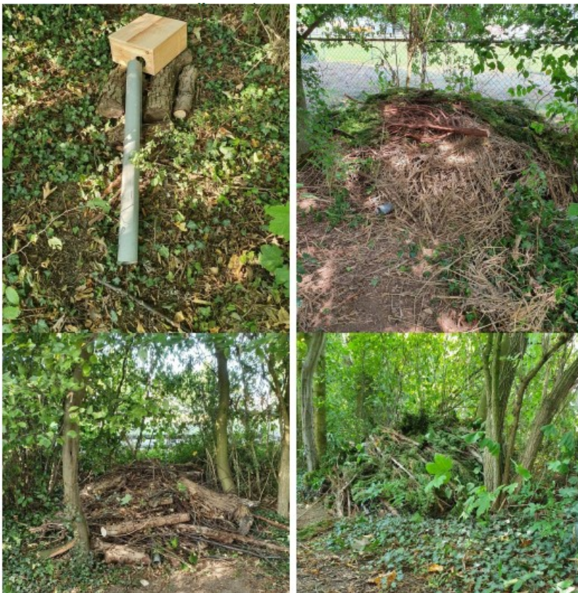
Figuur 8. Weergave marterkassen bedekt met takkenrillen aan de buitenzijde plangebied.