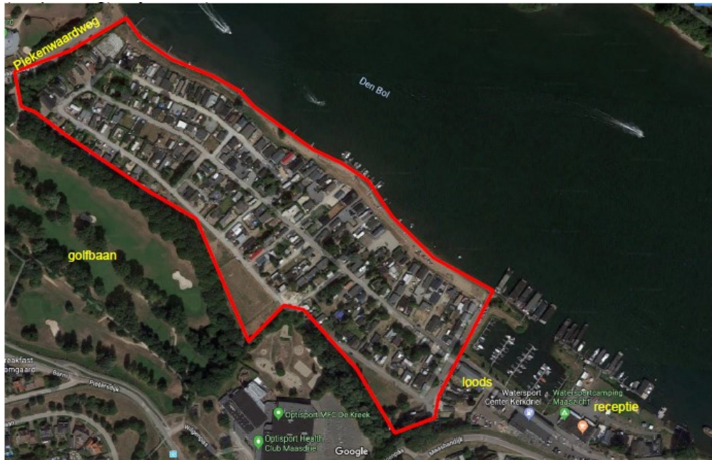
Figuur 1. De ligging van het plangebied (rood begrensd) met enkele toponiemen.