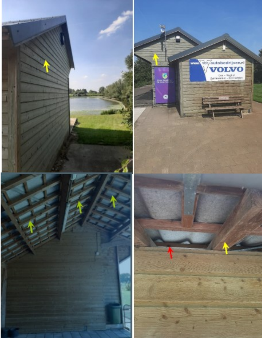
Figuur 6. Boven locatie van de plaatsing gevelbetimmering. De vloermuiskasten worden tegen de nok aan geplaatst en daaronder wordt de gevelbetimmering aangebracht. Onder, locatie van de te plaatsen platen tegen de tengellatten (gele pijl). Tussen de dakplaat en de tengellatten ontstaan compartimenten van 5cm bereikbaar voor vleermuizen via opening bij rode pijl.