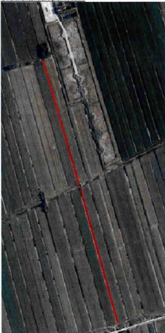
Figuur 1: De te dempen sloten aangegeven in rood.