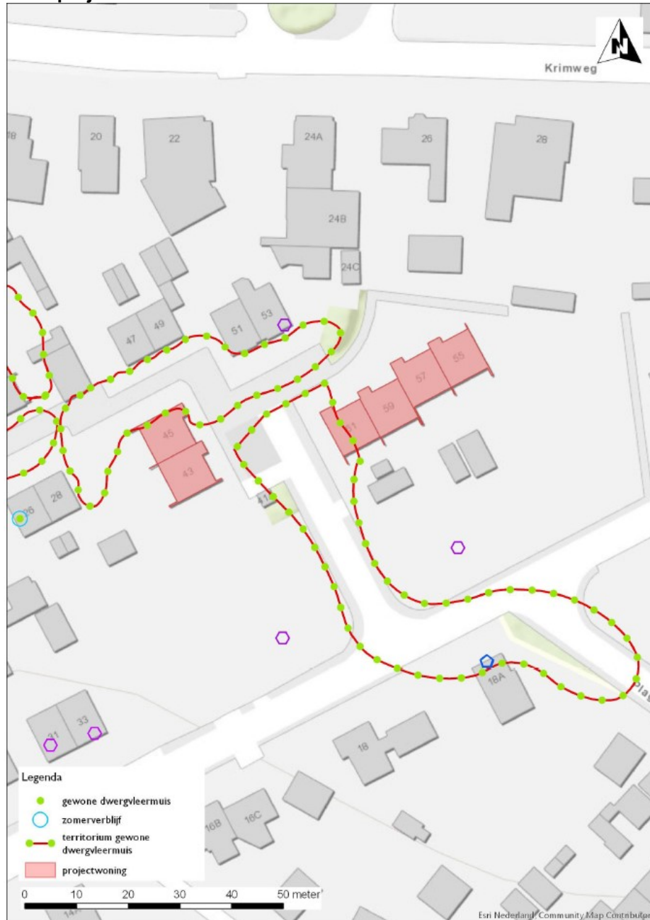
Fig 1: Te renoveren woningen (rood) paalbergweg, Hoenderloo (complex 1504) en onderzoeksresultaten nader onderzoek. Uit: Activiteitenplan Hoenderloo complex 1504 (Loopplan, 2019). Paarse en blauwe hexagoon's zijn huismussen en gierzwaluwen in de omgeving.