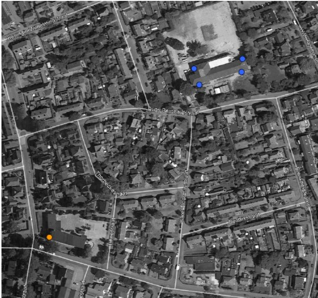
Figuur 2 De te slopen basisschool met de aangetroffen paarverblijfplaats van de gewone dwergvleermuis (oranje) en de aangebrachte tijdelijke voorzieningen voor de soort op circa 200 m afstand (blauw).