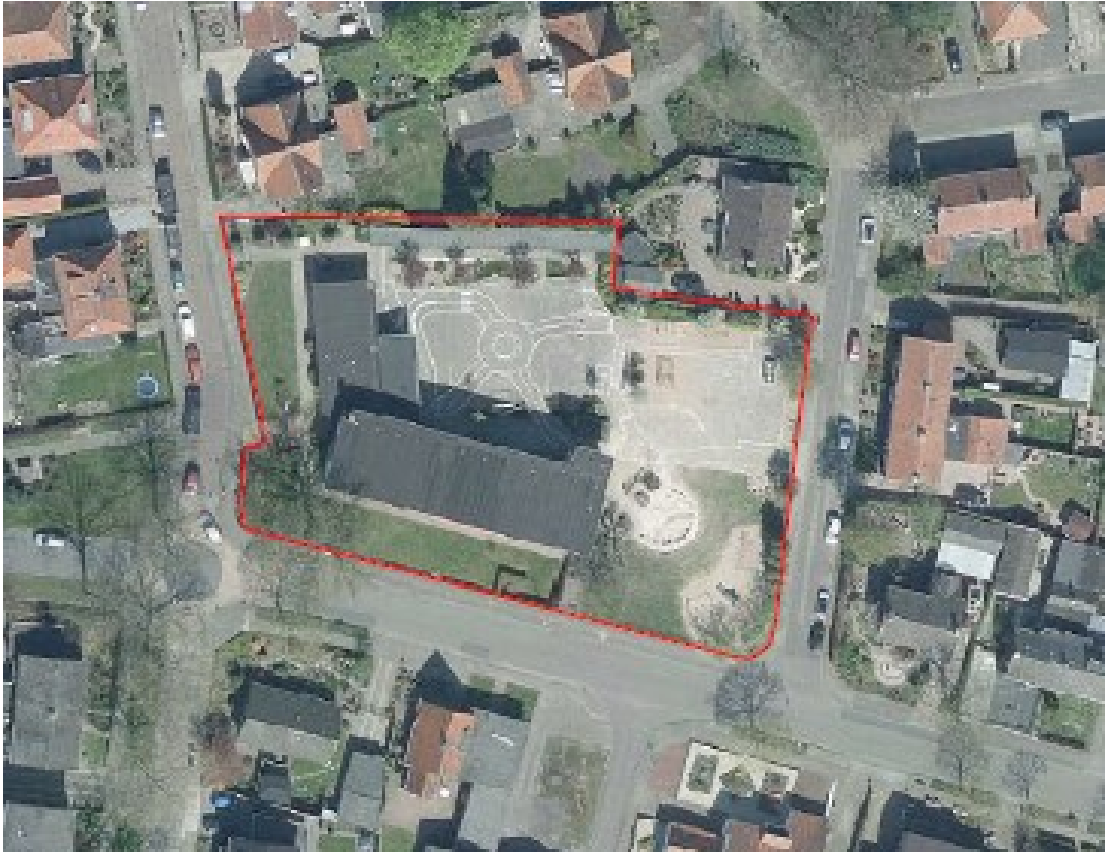
Figuur 1 Begrenzing plangebied (rood omljnd).