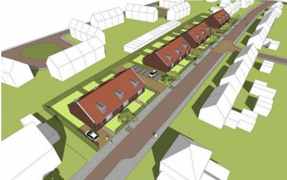
Figuur 3: Impressie van de 12 nieuwbouwwoningen. De permanente voorzieningen worden in de nok van de kopgevels gerealiseerd, zodat de minimale hoogte wordt gehaald.