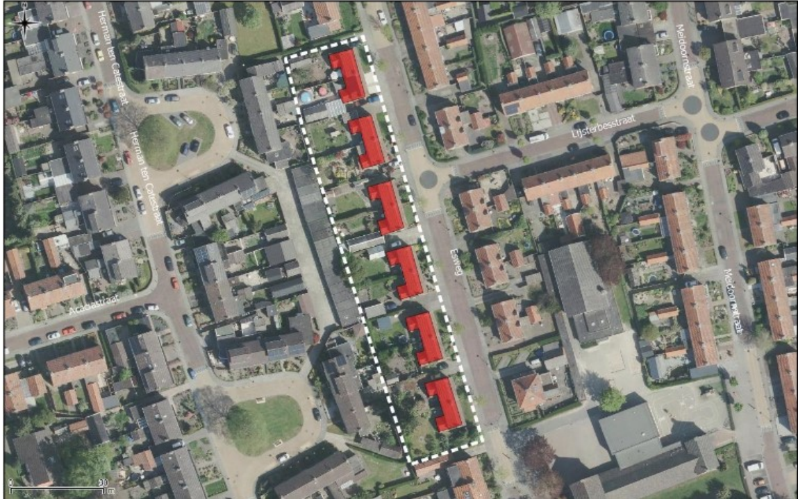
Figuur 1: Luchtfoto van het plangebied Esweg 2c t/m 24 te Eibergen