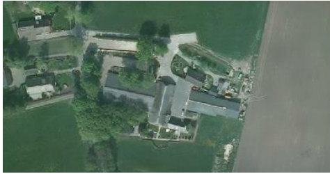
Luchtfoto huidige situatie