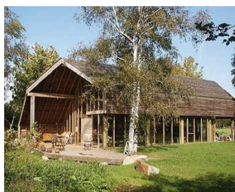
Voorbeelden van woningen die zich voegen naar het landschap. Het betreffen hier voorbeelden van niet alledaagse, meer experimentele architectuurvormen