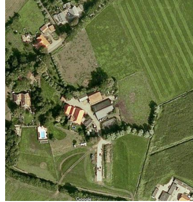
Luchtfoto huidige situatie