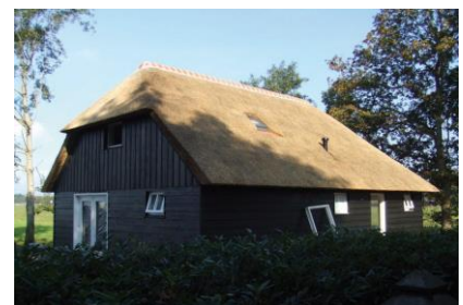
Voorbeeld van een woning denkbaar bij een oude boerderij.