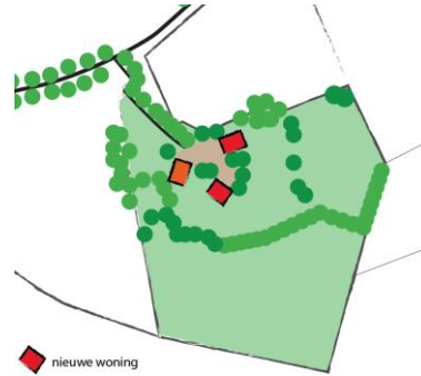
Voorbeeld schets bij principeverzoek (mag ook met de hand)