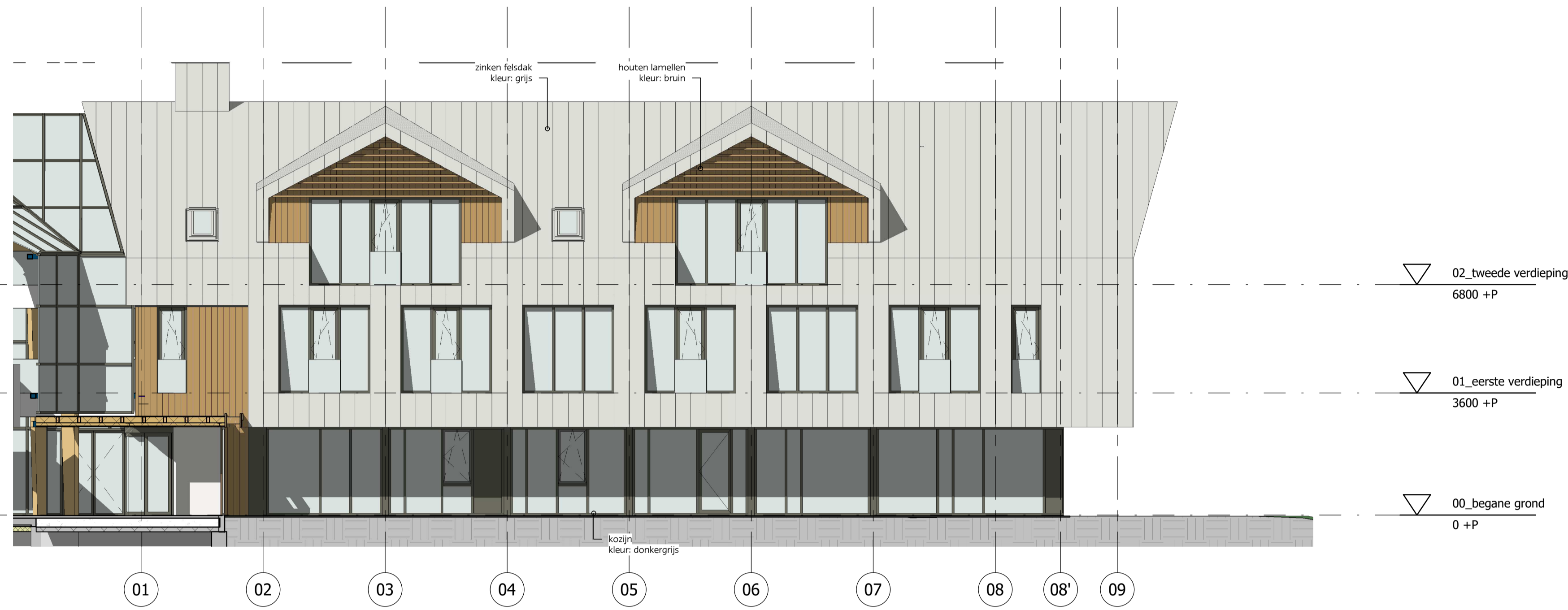
vleugel zuid voorgevel