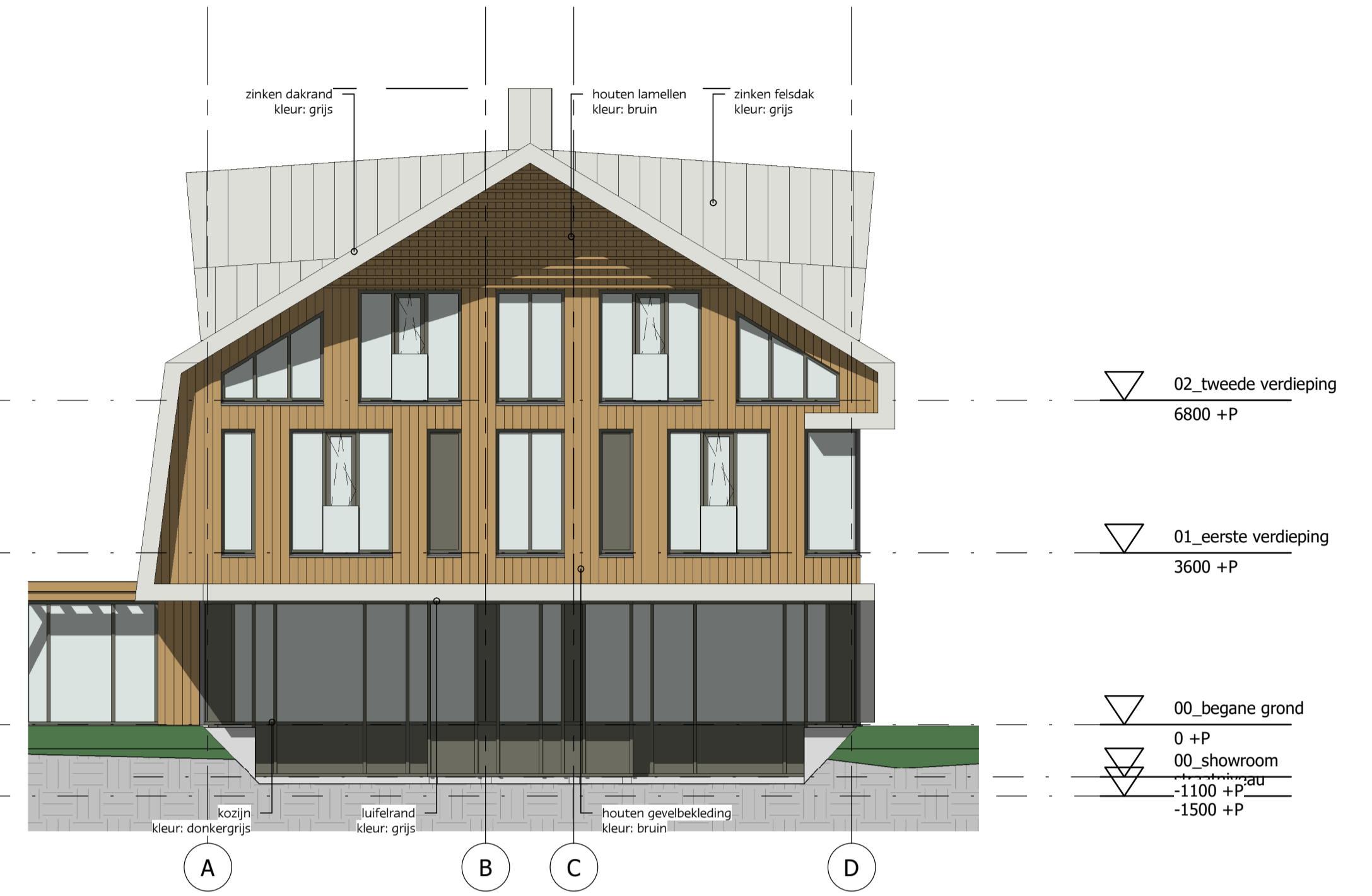
vleugel zuid kopgevel