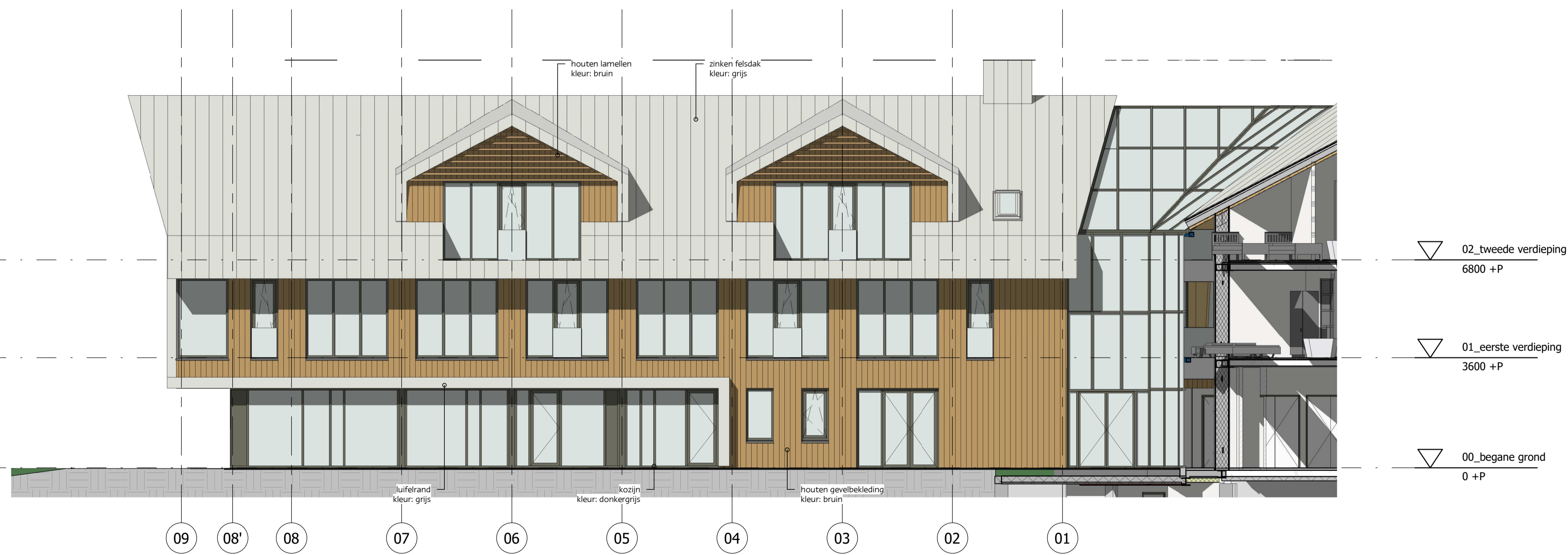
vleugel zuid achtergevel